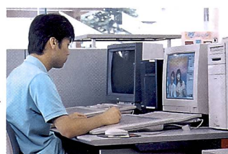
Professionelle Gestalter erfüllen jeden Kundenwunsch.