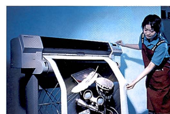
Dem Ausgabeformat sind kaum Grenzen gesetzt.

Team übernimmt alle Arten von Gestaltungsaufträgen für Prospekte, CD-ROMs oder Internetseiten, eine Spezialabteilung macht Aufzieh- und Laminierarbeiten, und wer sich gerne selbst an den Computer setzt, dem stehen spezielle Kundenarbeitsplätze mit oder ohne fachlicher Anleitung zur Verfügung.