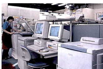
Geräte für jede Art der Bildbearbeitung und Bildausgabe.