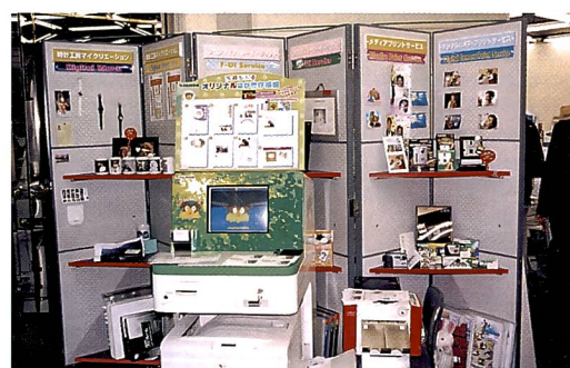
Für schnelle Visiten- und Glückwunschkarten gibt es eine menügeführte Selbstbedienungsstation.