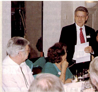
Gratulationen durch den ISFL-Präsidenten Rolf Nabholz.