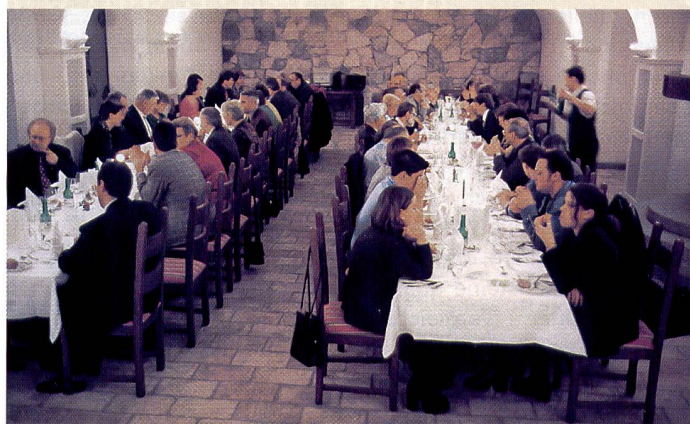
Im romantischen Kellergewölbe des Hotel Hirschen fand das traditionelle Festbankett statt.