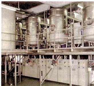
Verdampfungsanlage für Fotochemikalien.

Rethmann Suisse beschäftigt sich seit fast 20 Jahren mit der Verwertung und Beseitigung von Sonderabfall. Der Ursprung der Unternehmenstätigkeit liegt in der Silberückgewinnung aus verbrauchten Fotobädern und Filmen. Rethmann Suisse ist deshalb schon seit langem Partner von Fotofinishern, und mit dem Aufkommen der Minilabs auch des Fotofachhandels. Abgesehen davon ist Rethmann Suisse seit Jahren Marktführer im Bereich der Entsorgung von Röntgenchemikalien und betreut rund 175 Spitäler und 3000 Ärzte.