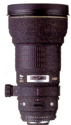
SIGMA APO 300 mm F2,8 EX HSM

Durch den Einsatz neu des entwickelten ELD Glases in der vorderen Linsengruppe bietet dieses lichtstarke Teleobjektiv scharfe, kontrastreiche Bilder mit besten anastigmatischen Eigenschaften. Der Hyper Sonic Motor (HSM) gewährleistet eine geräuschlose und extrem schnelle Scharfeinstellung. Ausserdem ist manuelles Fokussieren ohne Umschaltung jederzeit möglich. Die Innenfokussierung und die drehbare Stativschelle sorgen für ausgezeichnete Handhabung und Stabilität. Eine Filterschublade mit von aussen zu bedienender Drehfassung erleichtert den Einsatz eines Pol-Filters. Diese leise AF-Teleobjektiv hoher Lichtstärke ermöglicht Aufnahmen, die Ihnen sonst entgingen.