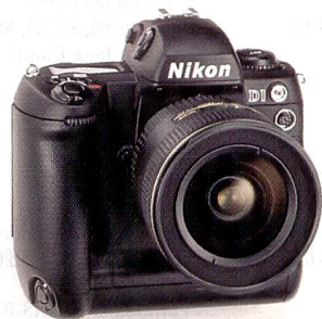
Bringt Preise ins Rutschen: Nikon D1 für unter Fr. 10'000.–.

Bei den professionellen Spiegelreflexkameras handelt es sich um Spitzenmodelle, deren Gehäuse von Canon oder Nikon kommen. In das Kameragehäuse sind neben der technischen Grundausstattung in der Regel der Bildsensor, der Anti Aliasing-Fil-