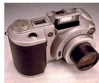
Hervorragende technische Ausstattung: Fujifilm MX-2900

Digitalkameras werden im Zusammenhang mit dem Internet immer wichtiger, denn das weltweite Kommunikationssystem beschränkt sich keineswegs nur auf Geschriebenes. Je länger je mehr werden auch Bilder über «das Netz der Netze» ver-