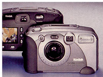
Kodak DC 260 Zoom mit GPS-Navigation für Standortangabe.