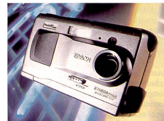
Nicht nur Fotofirmen sind im Geschäft: Epson PhotoPC 800.

Alle Modelle lassen sich am heimischen TV anschliessen, damit die Bilder am Fernsehbildschirm betrachtet werden können. Die serielle Schnittstelle dient der Datenübertra-