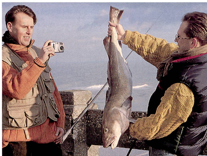
Erlebnisse digital festgehalten. Immer mehr Leute benutzen Digitalkameras für die Kommunikation im Internet.

Digitalkameras mit mehr als 1,5 Mpix gehen ganz klar in Führung: Immer bessere Bildqualität bei günstigem Preis. Wir haben die wichtigsten Modelle für Sie in einer Marktübersicht zusammengestellt.