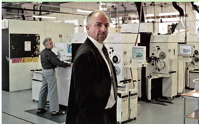
4 Agfa Dimax Printer