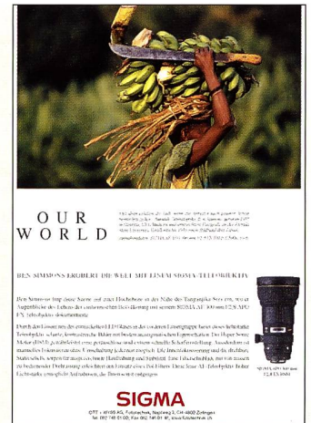
Die Sigma-Werbung mit den beispielhaften Reportagefotos wurde als «drittbeste Anzeige des Jahres 1999» auserwählt.

ganzseitige Sujets im Jahre 1999 in FOTOintern geschaltet und in der Ausgabe 20/99 zur Abstimmung vorgeschlagen wurden, ihre Favoriten auswählen für die beste, die zweitbeste und die drittbeste Anzeige des Jahres 1999. Unter den jeweiligen Kategorien entschied das Los. Die Gewinnerin und Gewinner wurden vom Verlag umgehend benachrichtigt. Wir möchten an dieser Stelle unseren Inserenten danken, die sich abermals bereit erklärt hatten, bei diesem Wettbewerb mitzumachen. Der Wettbewerb beweist einmal mehr, dass sich die Leserschaft von FOTOintern sehr intensiv mit den Anzeigenmotiven auseinandersetzt. Hier die Gewinnerkommentare: