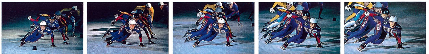
Bild für Bild für Bild für Bild für Bild gestochen scharf

Mit einer Nikon F100 gibt es nicht nur Sieger vor der Kamera, sondern auch Winner dahinter. Denn wie die legendäre Nikon F5 hat auch die Nikon F100 das weltbeste Autofokussystem. Es garantiert gestochene Schärfe selbst dann, wenn sich das Motiv wie ein Weltmeister bewegt und das Licht rekordverdächtig schlecht ist. Mit dem schnellen, präzisen AF haben Sie nie mehr eine Zwei am Rücken.