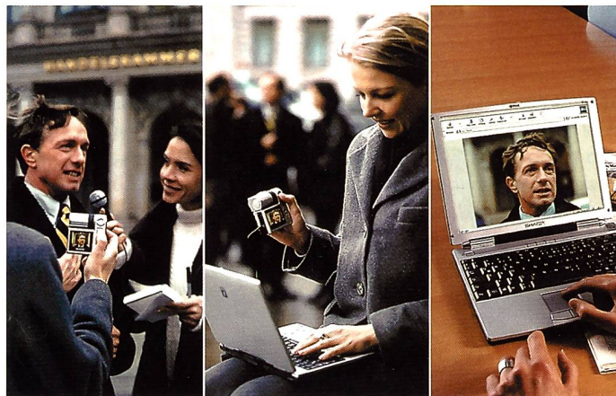
Die Sharp ViewCam VN-EZ5 ist für Journalisten konzipiert: Die Daten können sofort übers Internet in die Redaktion geschickt werden.

MB-Smartmedia-Card können bis zu 120 Minuten Videoaufzeichnung mit Ton oder maximal 1152 Standbilder gespeichert werden. Anschliessend lassen sich die digitalen Daten