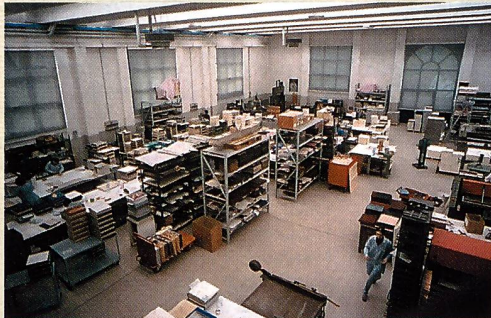
Im taghellen Produktionsraum fällt die manuelle Arbeit mit vielen Qualitätskontrollen auf.