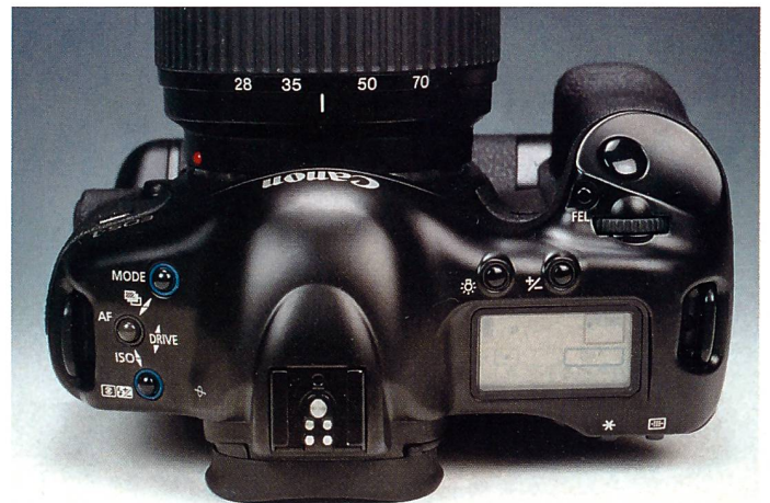
Bei der neuen Canon EOS-1V fällt die Abwesenheit der Rückspulkurbel auf. Viele der Bedienungstasten haben Mehrfachfunktionen.