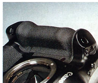
Sensationelle Ergonomie: der Handgriff der Canon EOS-1V.