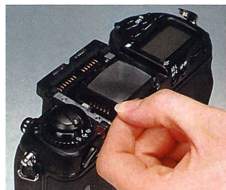
Bei F5-Fotografen besonders beliebt ist das auswechselbare Suchersystem und das einfache Wechseln der Einstellscheiben.