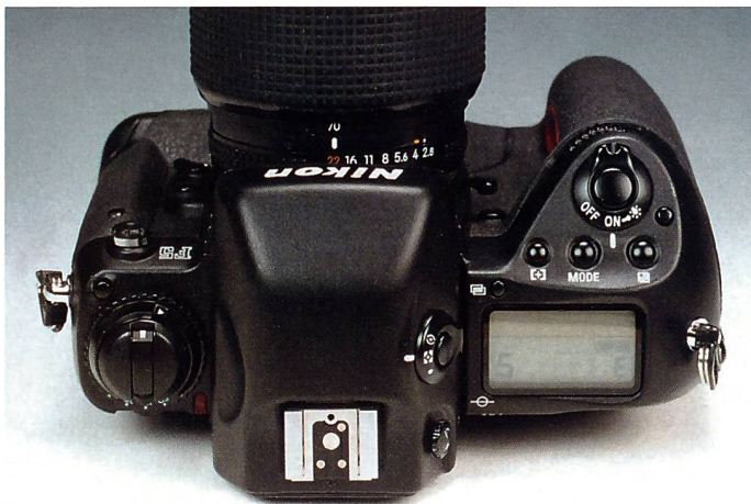
Die Oberseite der Nikon F5 präsentiert sich durch eine logische und übersichtliche Anordnung der Bedienelemente.

oder alle zusammen für AF-Dynamik. Die Anzeige der Messfelder erfolgt schwarz auf der Einstellscheibe. Die EOS-1V bietet dagegen nicht weniger als 45 Messfelder, sieben davon sind Kreuzsensoren. Die Anzeige erfolgt leuchtend rot auf der Einstellscheibe, wobei bei Grossfeld-