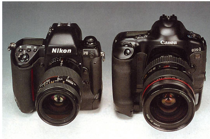
Die zwei Boliden der Profis: Links die seit Jahren bewährte Nikon F5, und rechts der topmoderne Newcomer Canon EOS-1V.

Canons neueste Kamera belebt das SLR-Rennen auf Top-Niveau. Noch extremer als bei den 800-PS-Boliden beherrschen hier zwei Rennställe die High-Speed-Szene.