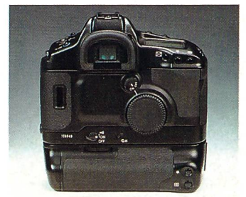
Das grosse Drehrad ist ergonomisch in Daumenreichweite.

der EOS-Geschichte, und sie ist auch die schnellste – rund drei mal schneller als die CPU der EOS-1N und rund 34 Prozent schneller als die EOS-3 mit 24,576 MHz.