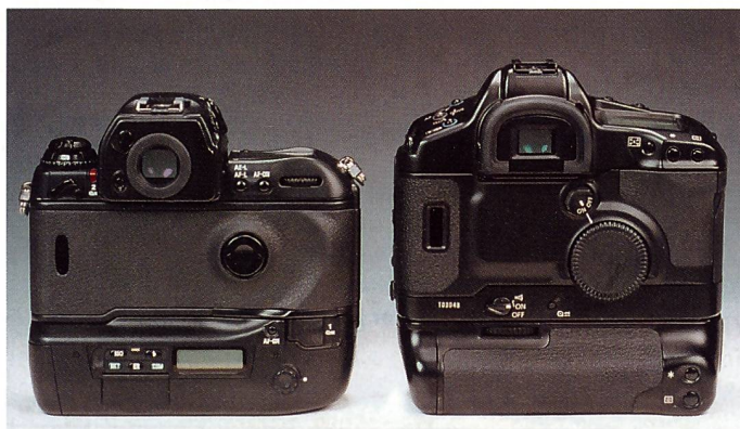
Die Kamerarückwand wird für die Platzierung von Funktionselementen immer wichtiger. Komfortabel: das grosse Drehrad der EOS-1V.

schieden. Während die EOS-1V mit einem integrierten Sucher und Wechsel der Einstellscheiben via Spiegelgehäuse arbeitet, verfügt die F5 über ein einfach austauschbares Suchergehäuse. Letzteres ist elegant, aber eine klar teurere Lösung, allerdings mit dem Vorteil der Flexibilität. So gibt es zur F5 vier verschiedene Sucher. Im Vergleich sind die Sucherbilder fast identisch, das der EOS-1V wirkt eine Spur heller, kühler und schärfer.