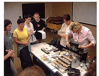
Stimmungsbilder aus den drei Workshops, die anschliessend an die Generalversammlung des ypp bei Pro Ciné in Wädenswil stattfanden.

etwas über Trends und neue Arbeitstechniken sagt – oder sagen kann – dann entsteht bei den Lehrlingen entweder ein enormer Nachholbedarf, oder sie verlieren die Lust an ihrem Beruf. Und genau da haken wir ein. Wir bieten diesen Jungen Workshops und Seminare, die sonst kaum wo zu finden sind.