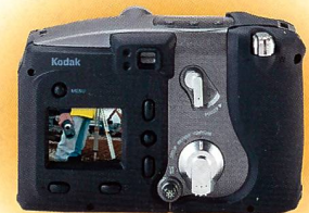
Die neue KODAK DC5000 Digitale Zoomkamera

Image Trade Bahnhofstrasse 14 5745 Safenwil Tel. 062 797 95 90 Fax 062 797 95 91