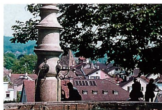
Je länger die Brennweite, desto stärker wird der Hintergrund unscharf aufgelöst.