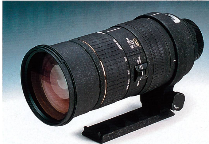
Nur knapp 22 cm lang ist das Sigma-Zoom mit 50-500 mm Brennweite.

Objektive mit grossen Zoombereichen sind in Mode. Sigma hält hier mit dem neuen 50-500 mm – von TIPA als bestes Objektiv ausgezeichnet – den Rekord.