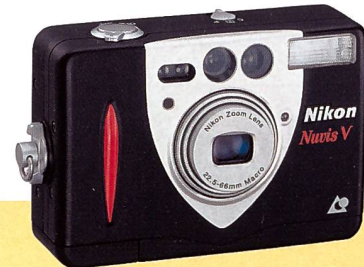
Nikon Nuvis V