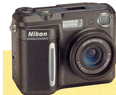
Nikon Coolpix 880

Zur photokina stellt Nikon drei wichtige Produkte vor: eine Digitalkamera mit 3,3 Mpix, ein Spiegelreflexmodell, neue Objektiv und eine Nuvis APS-Kamera.