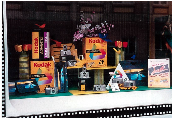
Die prämierten Schaufenster zum Thema «Frühling» von Photo du Temple, J.-C. Matthey aus Le Locle (links) und Foto A. Scheidegger aus Basel (rechts).

Schaufenster und schicken Sie die Fotos mit Adresse auf der Rückseite an Kodak. Den Wettbewerb zum Thema Frühling, dessen Einsendeschluss bereits der 15. Juni war, haben Foto A. Scheidegger aus Basel und Photo du