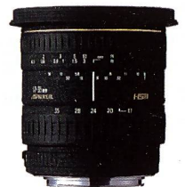
SIGMA 17-35 mm F2,8-4,0 EX ASPHERICAL HSM