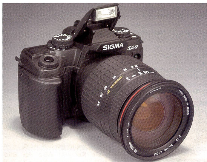
Sigma, einer der grössten Objektivhersteller, bringt zwei eigene Spiegelreflexmodelle auf den Markt, die sich durch ein besonders günstiges Preis-/Leistungs-Verhältnis auszeichnen.

Sigma ist kein Neuling im Kameramarkt, nur waren die bisherigen Spiegelreflexkameras in der Schweiz kaum erhältlich. Wir haben das neueste Topmodell, die SA-9, einem Praxistest unterzogen. Hier unsere Erfahrungen.