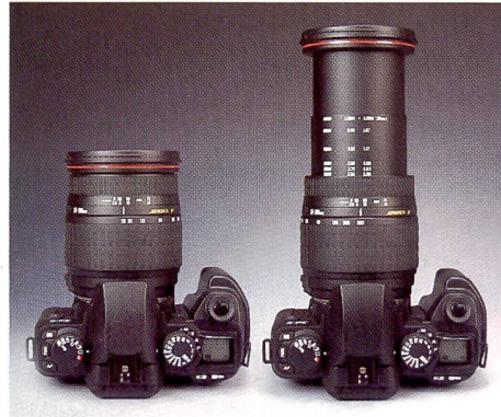
Interessantes Objektiv dazu: Das Hyperzoom 1:3,5-6,3/28-300 mm ist nur 10,3 cm lang, wiegt 570 Gramm und bietet uferlose Möglichkeiten.

Trotzdem: Die SA-9 ist eine für ihren Preis gute, technisch sehr vielfältig ausgestattete Kamera, die wenig zu wünschen übrig lässt. Beachtet man zudem die von Sigma angebotene