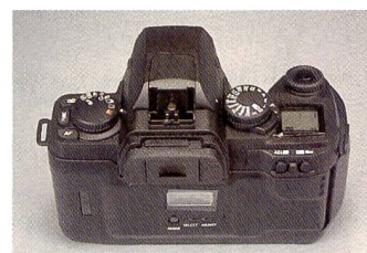
Die Sigma SA-9 besitzt in ihrer reichhaltigen Grundausstattung auch eine Datenrückwand, mit der Datum und Uhrzeit einbelichtet werden kann.

Beide Kameras haben eine Abblendeblende zur Kontrolle der Schärfentiefe und können (optional) über Funk fernaus-