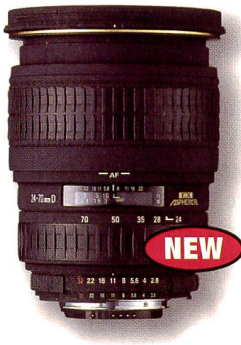
Sigma 24-70 mm F2,8 EX D Aspherical

Sigma-Objektive mit der Bezeichnung D wurden für hochauflösende SLR-Digitalkameras entwickelt. Denn nur mit diesen Objektiven hält der Digitalfotograf alle Feinheiten und Tonwerte, die der Chip erkennen kann, fest. CCDs benötigen bis 130 Linienpaare Auflösung, einfache Standard SLR-Objektive leisten durchschnittlich jedoch nur 50 Linienpaare.