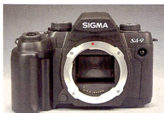
Die beiden Sigma-Modelle sind mit einem eigenen Bajonett ausgestattet, zu dem es von Sigma 26 Wechselobjektive von 8 bis 800 mm gibt.

Das LCD-Display schliesslich zeigt die Blende, die Blitzbetriebsart, die Filmempfindlichkeit, die Belichtungsmesscharakteristik (Matrix, Selektiv- oder Mittenbetonte Integralmessung) an. Allerdings wird die ermittelte Verschlusszeit im Automatikbetrieb auf dem Display nicht angezeigt, lediglich im Sucher. Das kann etwas umständlich werden, wenn man ab Stativ fotografiert. Auf der linken Kameraseite sind drei Tasten und ein Einstellrad angebracht. Mit den Tasten werden die Autofokus-