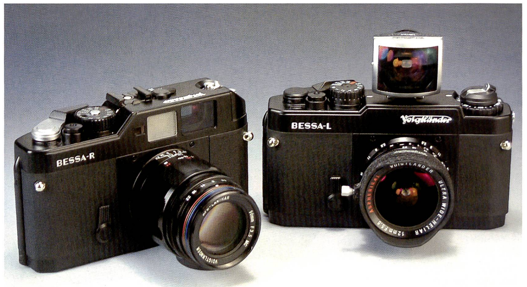
Die Bessa-R mit eingebautem Sucher, für die Bessa-L ist ein Aufstecksucher erforderlich.

schwach ist. Die Belichtungs- messung - das einzige Zuge- ständnis an die Neuzeit - arbei- tet einwandfrei, unsere Test-Bilder waren allesamt richtig belichtet. Mit der Schär- fe ist das weniger einfach (was aber auch dem ungeübten