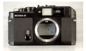
Fotografieren wie einst Capa und Co.: Bessa-R.

Linse (TTL-Messung, Bessa nennt das mittenbetonte Durchschnittsmessung). Eine Silizium-Fotozelle ermittelt das vom Lamellenverschluss reflektierte Licht und aktiviert drei Leuchtdioden, die im Sucher anzeigen, ob die Belichtung zu stark oder zu