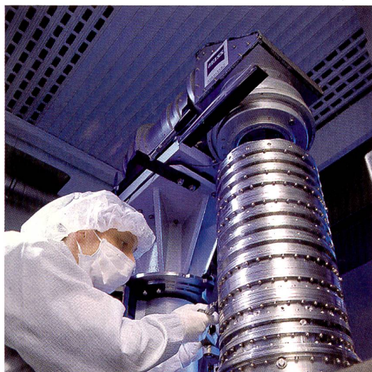
Bei der Justage wird die Auflösung der Halbleiterobjektive von Carl Zeiss auf Höchstleistung getrimmt. Im Bild: Ein Objektiv vom Typ Starlith 900 für die Belichtungswellenlänge 193 nm.

Interessantes war von Peter Körsgen zu hören: Bei Sony geht man davon aus, dass der Markt für Kameras für die digitale Fotografie bald grösser ist, als jener für Camcorder. Im übrigen ist man bei Sony überzeugt davon, dass der Kunde – trotz massivem