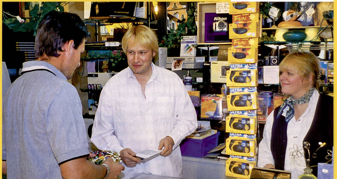
Foto Salomon hat eine sehr breite Kundschaft, die aus Pully, Lutry, ja bis St. Sulpice nach Lausanne an die Avenue Tissot kommt. Das Geschäft ist gut erreichbar, liegt in Bahnhofnähe und – das ist mitentscheidend –

es gibt Parkplätze vor dem Laden. Die vorwiegende Stammkundschaft schätzt ganz besonders die konstante und hervorragende Bildqualität von Foto Salomon. Nie kämen sie auf die Idee, ihren Film in eine anonyme Tüte zu stecken und sind dafür gerne bereit, etwas tiefer in den Geldbeutel zu greifen.