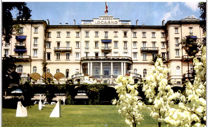
Unser Tagungsort: Grand Hotel Locarno

Grazie mille Marco Garbani und bis bald im Ticino