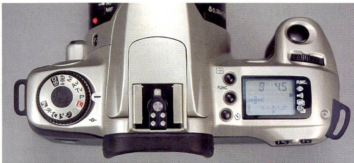
Canon EOS 300 besitzt als einzige Schärfentiefenautomatik

nichts. Der Kreis wird durch die TTL-Messung geschlossen: Die Belichtungsmessung erfolgt heute grundsätzlich durchs Objektiv, ob bei Dauerlicht oder mit Blitz. Auch hier verlassen sich die meisten Benutzer auf die mitenbetonte Innenmessung und überlassen die in vielen Fällen genauere Spotmessung den Fortgeschrittenen. Jetzt beginnt auch die Denkarbeit, denn wo man nun korrekt messen soll, ist gar nicht so selbstverständlich.