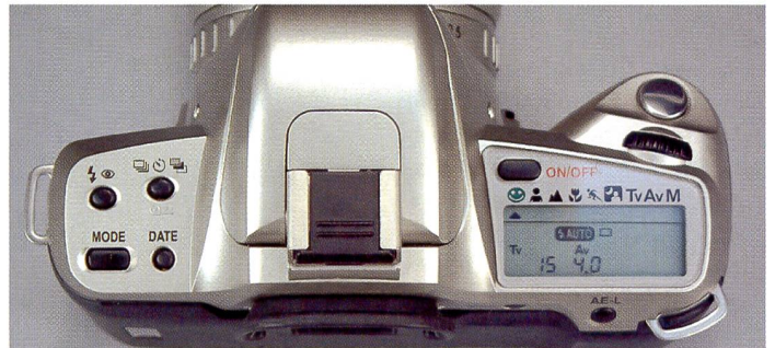
Pentax MZ-60 übersichtliche Bedienung mit Funktionstasten

die Spiegelreflexkamera als besonders prädestiniert. Und viertens, das Prestige . Es gibt nicht nur rationale, sondern auch emotionale Argumente: Eine Spiegelreflexausrüstung mit zwei Gehäusen, einem beeindruckenden Blitz und vier, fünf Objektiven – das ganze in einer völlig überdimensionierten Fototasche macht schon Eindruck! Natürlich, ich weiss, dass dies gerade auf Sie nicht zutrifft! Aber es gibt unzählige Fotoliebhaber, die sich genau deswegen eine Spiegelreflexkamera gekauft haben. Dass Sie diese dann überall hin mitschleppen müssen stört sie wenig