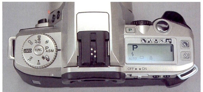
Minolta Dynax 4 mit dem schnellsten Autofokussystem