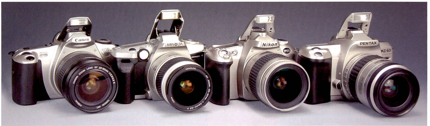
Vier Modelle im Vergleich: Noch nie waren Einsteiger-Spiegelreflexkameras mit so viel Spitzentechnik ausgerüstet wie heute.

Zweitens, die Bildqualität . Die Objektive sind (bis auf wenige Ausnahmen) besser korrigiert als bei Taschenkameras, weil die Ansprüche der Spiegelreflex-Fotografen höher sind als