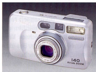
Kleinbildkompaktkameras Minolta Riva Zoom 140, 160 sowie die digitale F100 mit Target-AF

Sensorbereich vergrössert. Minolta spricht vom grössten AF-Messfeld, das je in einer Kleinbildkamera verwendet wurde. Es füllt das Sucherfeld zu rund 30 Prozent vertikal und zu 50 Prozent horizontal.