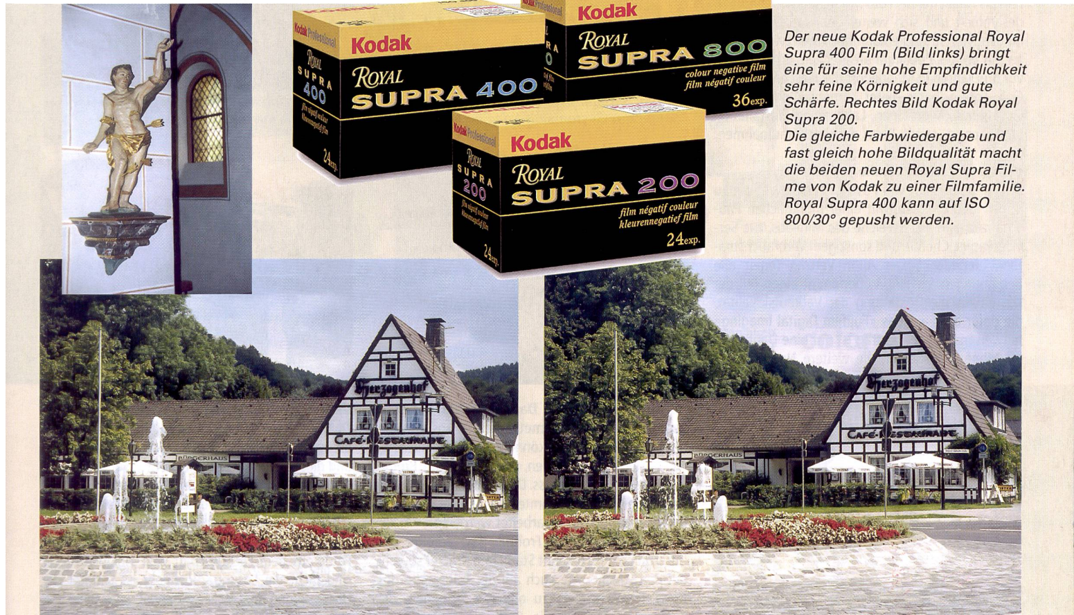
Der neue Kodak Professional Royal Supra 400 Film (Bild links) bringt eine für seine hohe Empfindlichkeit sehr feine Körnigkeit und gute Schärfe. Rechtes Bild Kodak Royal Supra 200.

Beschädigungen und führt zu einer höheren Bildqualität auch beim Scannen. Nicht zuletzt wurde die spektrale Sensibilisierung entspre- chend der Wahrnehmung des menschlichen Auges weiter- entwickelt. Das gleicht der bei Agfas Vista Filmen angewand- ten Technologie. Tatsächlich zeigten erste Tests bei beiden Filmen eine sehr feine Körnig- keit – beim 400er nur gering- fügig strukturierter – und eine hohe Schärfeleistung mit natürlichen Farben bei norma- ler Farbsättigung. Grün und Gelb erscheinen jedoch etwas