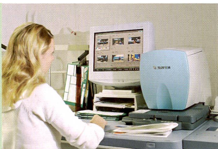
Die einfache Bedienung des FUJIFILM Frontier ermöglicht schon sehr schnell – nach kurzer Schulungszeit – eine hohe Produktivität.

Finanzierung der installierten Geräte wird sechs Monate vor Vertragsablauf neu geregelt. FUJIFILM installiert das Minilab und übernimmt die Schulung und Weiterbildung von zwei Personen. Die Schulung beinhaltet zwei Ausbildungstage bei FUJIFILM in Dielsdorf und einen dritten Tag beim Kunden. Ein vierter Ausbildungstag nach einigen Monaten soll die Lücken schliessen und Fragen, die während des Betriebs aufgetaucht sind, klären.