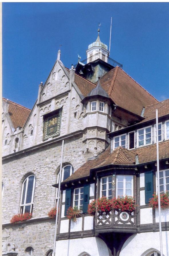
Links: Agfacolor Ultra 100 und rechts: Vista 100. Der neue Agfacolor Ultra 100 Film bringt farbintensivere Bilder als der herkömmliche Agfacolor Vista 100. Das fällt besonders beim brillanteren Himmelsblau, kräftigerem Rot und tiefen Schwarzen auf.

keit (ca. ISO 200/24°) zwangsläufig überbelichtet zu werden, erzielt der neue, höher empfindliche Film seine Bunttheit durch technologische Maßnahmen, wozu neue DIR-Kuppler gehören, die sehr hohe farbsteigernde Inter-Image-Effekte (Zwischenschicht-Effekte) ermöglichen. Die Negative des Agfacolor Ultra 100 sind daher nicht