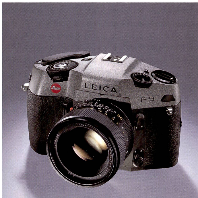
Formmässig ähnelt die neue Leica R9 der bisherigen R8. Der Finish des Gehäuses, in Anthrazit oder Schwarz, ist jedoch noch gepflegter.

Zur photokina stellt Leica eine neue Spiegelreflexkamera vor. Zudem präsentiert Leica ein Porträt- und Reportageobjektiv der Spitzenklasse. Wir hatten Gelegenheit, mit der exklusiven Kombination zu fotografieren.