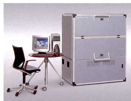
Epsilon Plus nennt sich der neue LED-Digitalbelichter, der Bilddaten in jedem Format auf RA-4 Materialien bis 76 cm Breite bringt.

völlig automatisch mit dem Durst Autocutter 32 oder 62 geschnitten werden können. Für eine schnelle Bedienung verfügt Theta 50 über eine Compaq True Digital Unix Workstation mit einer speziellen Benutzersoftware, einem leistungsstarken PS Level 3 RIP (Cheetah) von Durst Dice America und einem Color Management Softwaremodul.