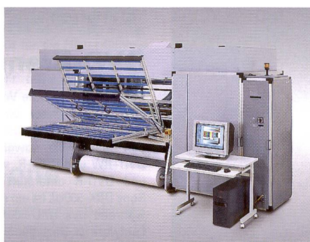
Rho 160 ist ein Hochleistungs-Inkjet-Drucker, mit dem flexible oder starre Trägermaterialien bis 40 mm Dicke bedruckt werden können.