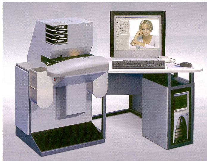
Der High-Speed Filmscanner Durst Sigma scannt alle Formate von APS bis 4x5" in einem automatischen Workflow.

Mit der Digitalisierung hat Durst ihr Kerngeschäft auf die professionelle Imaging Branche neu ausgerichtet. Die vier wichtigsten Neuheiten des südtiroler Technologieunternehmens betreffen Geräte für Fachlabors, Digitalshops und Spezialfirmen im grafischen Bereich.