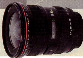
Neues EF-Objektiv 1:4/17-40mm USM für das EOS-System von Canon.

Das tat sie wirklich, denn erstmals präsentierte sie sich in zwei riesigen Hallen im soeben fertig gestellten Neubau des Las Vegas Convention Centers. Zudem belegen auch die endgültigen Besucherzahlen den Erfolg der diesjährigen PMA: 30'000 Branchenangehörige haben den Weg in die Stadt des Spiels und Vergnügens gefunden.