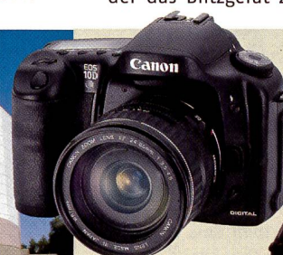
Die digitale Canon EOS 10D löst die erst einjährige EOS D60 ab.