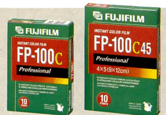
Die neuen Sofortbildfilme von Fujifilm, FP-100C und FP-100 C45.

Als weitere Digitalkamera des EasyShare Systems zeigte Kodak die DX6340 Zoom , eine 3 Mpix-Kompaktkamera mit optischem 4fach Zoom von Schneider Kreuznach, Mehrzonen-AF und manuellen Einstellmöglichkeiten. Ab April ist eine neue Easy Share Software Version 3,0 im Internet kostenlos verfügbar.