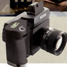
Die Sinar M wird jetzt ausgeliefert.