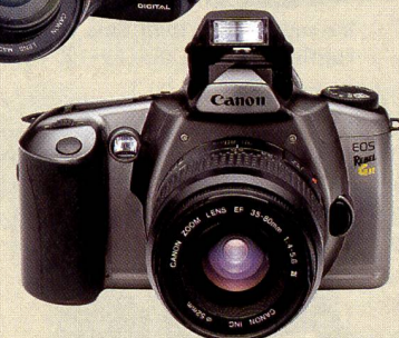
Die analoge Canon EOS 300V heisst in den USA "Rebel" III