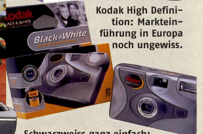
Schwarzweiss ganz einfach: Einfilmkamera B/W von Kodak.

Sofort Bilder dank Easyshare Printerstation.