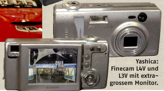
Yashica: Finecam L4v und L3v mit extra-großem Monitor.

fert. Die digitalen Rückteile Sinarback 54 und 43 sind ab sofort mit einer Firewire -Schnittstelle ausgestattet. Ausserdem läuft die Software CaptureShop 4.0 neu auch unter den Betriebssystemen OS 9 und OS X. Die Software kann kostenlos vom Internet heruntergeladen werden. CaptureShop verfügt über diverse neue Features wie eine blitzschnelle Interpolation von Bildausschnitten für perfekte Previews, Mehrfachbelichtungen und zusätzliche Funktionen beim Einblenden von Layoutskizzen, Bildern oder Previews ins Livebild.