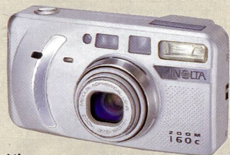
Minolta Zoom 160C: Klein, leicht und analog.