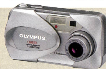
Camedia C-350: Ideal für Einsteiger.