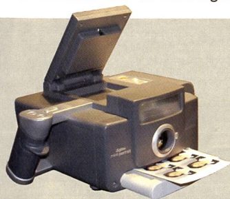
Polaroid zeigte die digitale Miniportrait Passbildkamera (oben), den neuen T690 Sofortbildfilm (unten) und die trendige Sofortbildkamera Polaroid One (Bild rechts).

Einer der grossen Vorteile der digitalen Fotografie, die sofortige Bildkontrolle, greift oft nicht, weil die viel zu kleinen Monitore keine schlüssige Bildbeurteilung – vor allem bei starkem Sonnenlicht – zulassen. Kyocera schafft hier Abhilfe, indem den neuen Finecam L4v und Finecam L3v einen besonders grossen 2,5 Inch LDC-Monitor eingebaut wurde. Die beiden Kameras sind in der Ausstattung praktisch identisch, sie verfügen über ein 1:2,8-4,7/5,8-17,4 mm optisches Zoom (entspricht 38-115mm bei Kleinbild), elektronischen Verschluss mit Zeiten von 4s