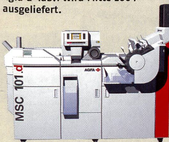
Ab sofort mit «Film-auf-CD»-Option: Agfa Minilab MSC 101.d