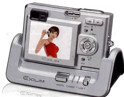
USB-Dockingstation mit Dia-Show-Funktion