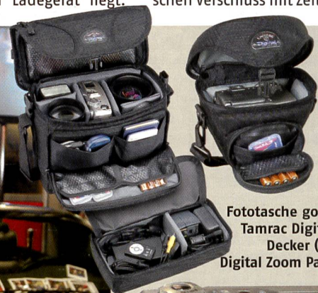
Fototasche goes Digital: Tamrac Digital Double Decker (links) und Digital Zoom Pack (oben).