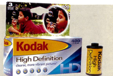
Kodak High Definition: Markteinführung in Europa noch ungewiss.