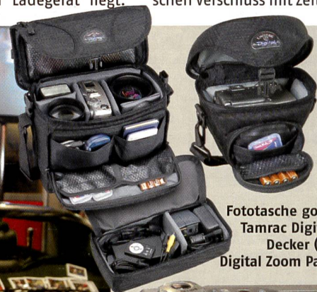
Fototasche goes Digital: Tamrac Digital Double Decker (links) und Digital Zoom Pack (oben).