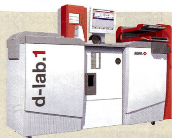
Der erste Prototyp: Agfa d-lab.1 wird Mitte 2004 ausgeliefert.

Die US-Firma Camerz Photo Products präsentierte eine Stativhalterung für die Kodak DCS Pro 14n Digital, mit der sich die Kamera genau um die optische Achse des Objektivs vom Quer- aufs Hochformat drehen lässt. Zudem sind eine Gegenlichtblende mit integrierter Filterhalterung erhältlich und eine Blitzbefestigung, bei der das Blitzgerät zentriert über