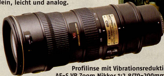
Profilinse mit Vibrationsreduktion: AF-S VR Zoom Nikkor 1:2,8/70-200mm G.

Mit dem Dimage Messenger hat Minolta auf der PMA eine Software gezeigt, die es ermöglicht, einen oder mehrere bestimmte Bildteile zu markieren, zu vergrössern und den Ausschnitt oder das ganze Bild mit einem Text zu versehen. Wird das Bild per E-Mail versandt, kann der Empfänger seinen eigenen Kommentar hinzufügen und das Bild retournieren oder weiter senden. Ausserdem können Bilder, Ausschnitte und Kommentare ausgedruckt und archiviert werden.