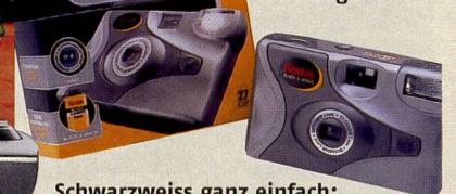
Schwarzweiss ganz einfach: Einfilmkamera B/W von Kodak.

Sofort Bilder dank Easyshare Printerstation.