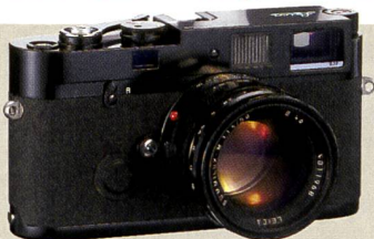
Leica MP: Mechanische Sucherkamera.

120mm bei KB), Einbaublitz, ISO 100, eingebautes Mikrofon und Lautsprecher. Die d20 motion kann auch als Webcam eingesetzt werden, sie ist in der Lage Videosequenzen im AVI-Format bis zu 60 s aufzuzeichnen und nutzt als Speichermedium eine SD Memory Card. Sie verfügt zudem über einen internen Speicher von 8 MB. Die Rollei d20 motion unterscheidet sich insbesondere darin, dass sie mit einem Fixfokus Objektiv und digitalem Zweifachzoom ausgestattet ist. Sie verfügt ebenfalls über einen internen Speicher von 8 MB, USB-Schnittstelle und Video-Aufnahmefunktion.