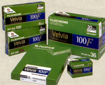
Der Velvia 100F von Fujifilm ist in KB, 120 und 4x5" Formaten erhältlich.

20,8 MP: Digitales Rückteil für Fujifilm G680.