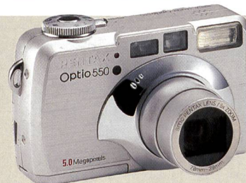
Zuwachs bei Pentax: Optio 550.