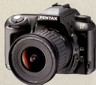
Klein und leicht: Die analoge *ist kommt demnächst als *ist D auch digital.

Gehäuses aus einer Magnesiumlegierung. Dank des als Zubehör erhältlichen Batteriemagazins mit Hochformat-Griff liegt die Kamera auch bei hochformatigen Aufnahmen perfekt und sicher in der Hand. Für den Anschluss eines externen Blitzgeräts steht ein Blitzschuh zur Verfügung. Blende, Verschluss und Schärfe lassen sich wahlweise manuell oder automatisch einstellen. Gezeigt wurden zudem folgende Wechselobjektive (die Werte in den Klammern entsprechen denen von Kleinbildkameras.): 1:2,8/300 mm (600 mm), 1:2,8 - 3,5/14 - 54 mm (28 - 108 mm), 1:2,0/50 mm Makro (100 mm) sowie 1:2,8 - 3,5/50 - 200 mm (100 - 400 mm). Weitere Details zum neuen SLR-System von Olympus auf Seite 16.