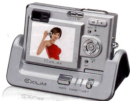
USB-Dockingstation mit Dia-Show-Funktion