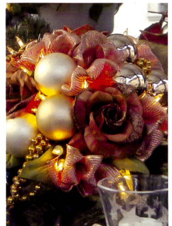
Dieses sehr detail- und kontrastreiche Sujet, wurde ohne Blitz oder Aufheller aufgenommen. Links: Rohdaten, ungeschärft; Mitte: im Photo Pro bearbeitet, USM-geschärft; rechts: im Photoshop drucküblich bearbeitet.