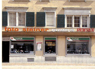
Die «In house»-Produktion bei Foto Steiner in Winterthur erweitert nicht nur das Dienstleistungsangebot, sondern motiviert auch das Personal.

Der Digitalboom bestätigt sich bei Foto Steiner auch im Kameraverkauf. Acht von zehn Kameras sind digitale, Spiegelreflexkameras – einst sein Kerngeschäft – machen 12 Prozent aus, der Rest sind analoge Kompaktmodelle. «Der Trend ist durch diese Zahlen eindeutig belegt,