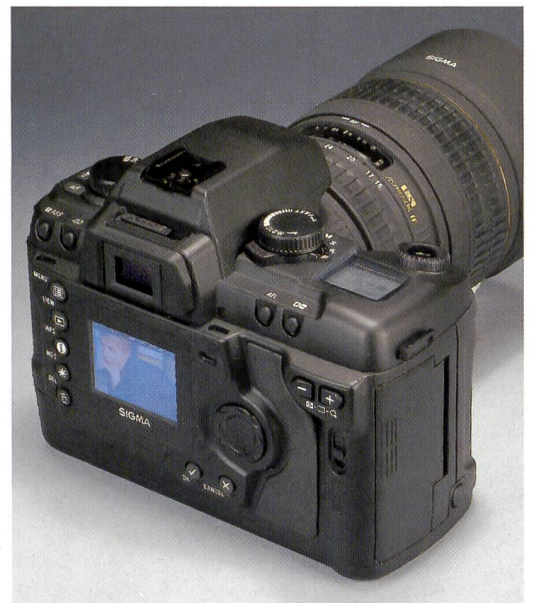
Die Sigma SD9 wirkt etwas bullig, ist aber handlich. Die Bedienelemente sind übersichtlich angeordnet und orientieren sich an der analogen SA9. Der grosse Monitor zeigt auf Knopfdruck die wichtigsten Bildinformationen.

blendtaste ist auf der linken Seite neben dem Objektivbajonett an der Vorderseite der Kamera platziert.