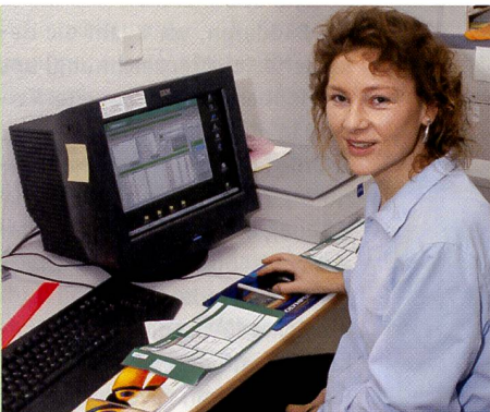
Eine unabhängige Workstation ist ideal um parallel zum Bilderprozess die CD zu brennen.

Schnellerer Service, eigene Qualitäts- und Produktionskontrolle und bessere Rendite seien die Hauptgründe, weshalb sich Steiner zu diesem Investitionsschritt entschieden hat. «Wichtig ist auch die Unabhängigkeit, denn in der heutigen Zeit kann man die Kunden nicht mehr zwei Tage warten lassen, bis die Bilder aus dem Labor zurück sind. Die Kunden wollen ihre Bilder sofort haben.»