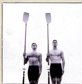
Row for gold: Die Werbefotografie war eher untervertreten. Hier die Arbeit von Comenius Röthlisberger, entstanden für die Imagebroschüre von Saurer.