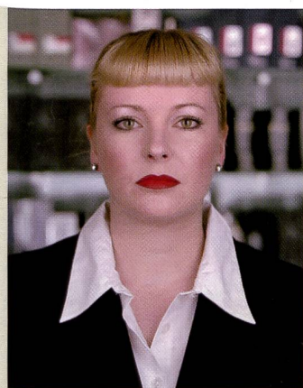
Esthéticiennes: Das Projekt von Raphael Hefti, eine Porträtsérie mit Parfümverkäuferinnen wurde mit dem Magazin Fotopreis 2002 ausgezeichnet.

Aus den über 535 Arbeiten mit insgesamt mehr als 3000 ausgelegten Bildern wurden in mehre-