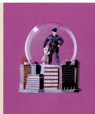
52 commemorative objects from ground zero: Robert Huber dokumentierte wie Geschichte zur Ware wird - der 11. September wird gnadenlos vermarktet.

vfg.» und den «vfg. Nachwuchsförderpreis». In Zusammenarbeit mit dem «Magazin», der Samstagsbeilage des Tages Anzeigers, wird ein mit 10'000 Franken dotierter Magazin-Fotopreis vergeben. Der diesjährige Preis geht an Raphael Hefti, 27. Er lebt und arbeitet in Zürich und London.