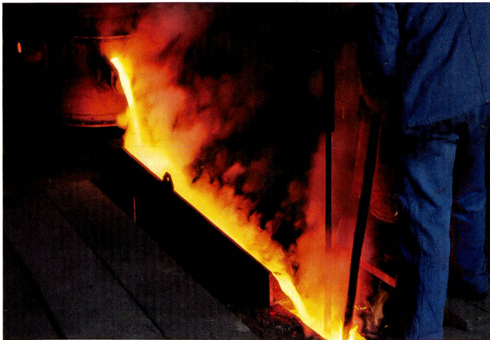
Überzeugende Bildqualität beim Einscannen wird auch ohne grosse Korrekturen nur mit der Grundeinstellung erreicht, vorausgesetzt natürlich, dass die Qualität der Vorlage stimmt.

Neu ist auch die Möglichkeit, manuell zu Fokussieren. Dies wird über ein Drehrad am Scanner bewerkstelligt. Über den Knopf «Quick Scan» lassen sich zudem bis zu sechs Bilder auf einmal mit einem einzigen Knopfdruck einscannen.