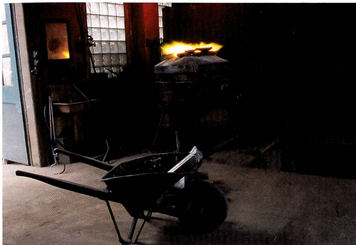
Auch in der Tiefenzeichnung in dunklen Bildpartien spielt der Dimage Scan Elite 5400 seine Stärken aus.

5400 über eine einfache Einrichtung, um das Korn zu reduzieren. Dabei handelt es sich um einen Diffusor, der ähnlich einer Softbox für weichere Ausleuchtung des Dias sorgt. Vorteil: Da es sich um eine Hardwarelösung handelt, wird nicht noch mehr Speicherplatz beansprucht und es ist auch kein zusätzlicher