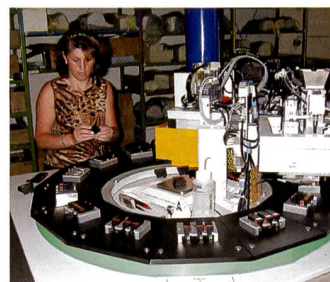
Testabfüllanlage in Schindellegi.

steller. Das Unternehmen ist in Schindellegi im Kanton Schwyz beheimatet und hat Produktionsbetriebe in Tschechien, Schanghai, Aegypten und in den USA. Dabei konzentrieren sich die 25 Mitarbeiter in der Schweiz in erster Linie um die Produkteentwicklung, um die Herstellung der Pro-