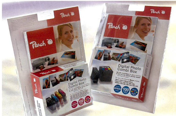
Farbechte Ausdrücke mit aufeinander abgestimmten Komponenten: Digital Photo Combi Box mit Tinte und Papier für 100 Ausdrücke 10 x 15 cm.

Hardware ist oft billig, das originale Verbrauchsmaterial dafür umso teurer. Der Schweizer Hersteller Peach kann Tintenpatronen zum halben Preis anbieten.