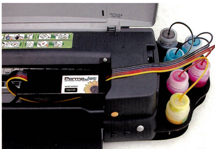
Das Permaflow-System von Permajet aus der Nähe betrachtet.

Wem das alles zu kompliziert erscheint, bleibt ein Trost. Immer mehr Profis bieten den digitalen Ausdruck auch als Dienstleistung an. Gegen entsprechende Bearbeitungsgebühr bedrucken Fotografen, kleine Firmen und Labors auf Wunsch fast alles, was sich überhaupt bedrucken lässt. Zudem findet die Methode auch immer mehr Anhänger im Fotofachhandel, wo neben dem klassischen Minilab oder gar als Ersatz desselben ein Inkjet Printer im Einsatz steht. Eric A. Soder