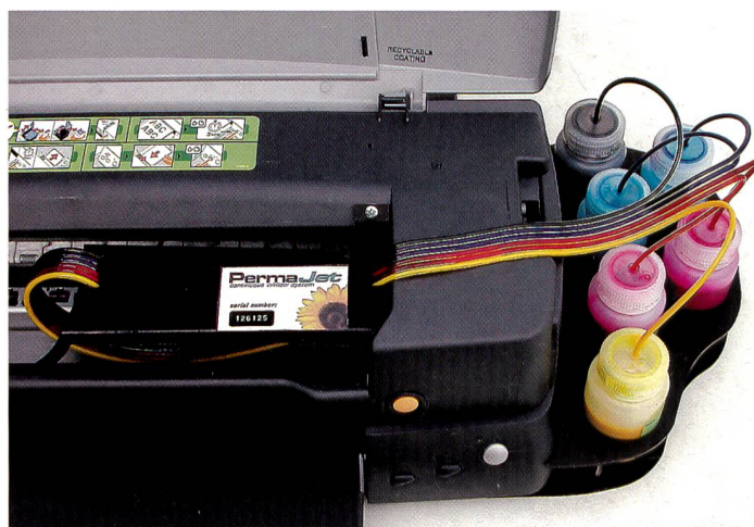
Das Permaflow-System von Permajet aus der Nähe betrachtet.

Wem das alles zu kompliziert erscheint, bleibt ein Trost. Immer mehr Profis bieten den digitalen Ausdruck auch als Dienstleistung an. Gegen entsprechende Bearbeitungsgebühr bedrucken Fotografen, kleine Firmen und Labors auf Wunsch fast alles, was sich überhaupt bedrucken lässt. Zudem findet die Methode auch immer mehr Anhänger im Fotofachhandel, wo neben dem klassischen Minilab oder gar als Ersatz desselben ein Inkjet Printer im Einsatz steht. Eric A. Soder