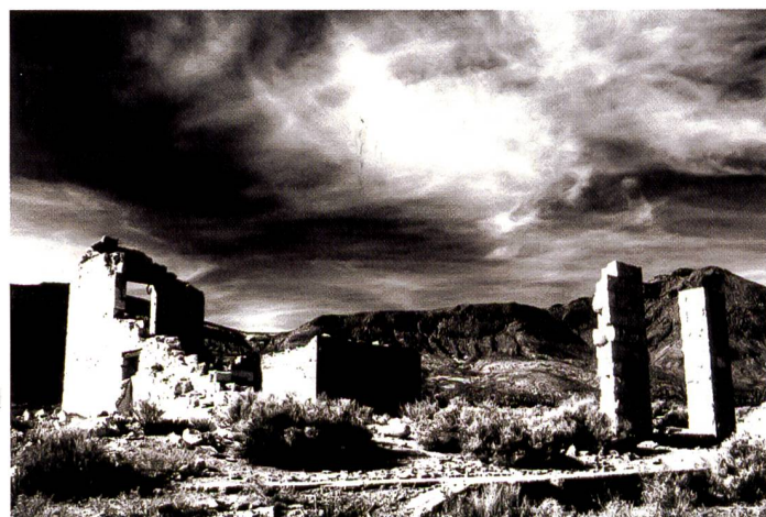
Der infrarotähnliche Effekt beruht auf der Kontraststeuerung mittels Gradationskurven und Manipulationen im Kanalmixer. Der Ausdruck mit Farbtinten erfolgte im RGB-Modus bei stark verringerter Farbsättigung.

Hier sind einmal grundsätzlich zwei Typen zu unterscheiden, nämlich Farbstoff- (Dye Inks) und Pigmenttinten. Selbstredend sind Papiere für beide Tintentypen auf dem Markt erhältlich.