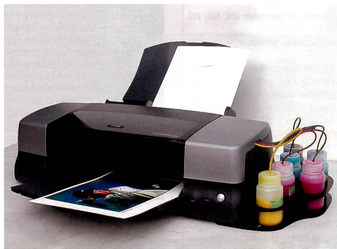
Unsere Versuchsanordnung bestand aus einem Epson 1290 Inkjetdrucker. Statt Tintenpatronen im Druckkopf wurden externe Tanks verwendet.

Schon seit geraumer Zeit haben sich Inkjet Drucker in Büro und Haushalt etabliert. Mehr und mehr setzen auch Fotografen auf Tintenstrahldrucker für die Bildausgabe. Der Umgang mit Tinte und Papier will für ein professionelles Resultat allerdings gelernt sein.