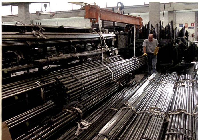
Rohre aller Formen und Durchmesser in einem gigantischen Lager.