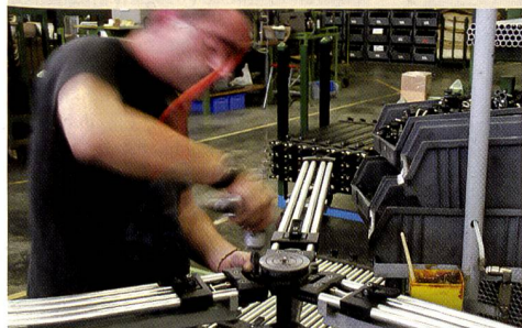
Werkzeuge werden bei Manfrotto gefertigt.