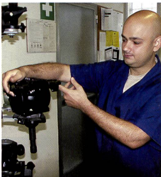
Montage von Kugelköpfen.

Gitzo, ein renommierter französischer Stativhersteller, gehört wohl der Vintec – nicht aber der Manfrotto-Gruppe an und stellt keine Konkurrenz im eigenen Hause dar. «Weil Gitzo die Märkte anders bearbeitet und Produkte vertreibt, die zwi-