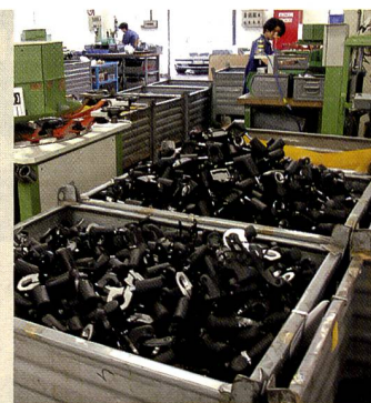
Endkontrolle und Spedition.