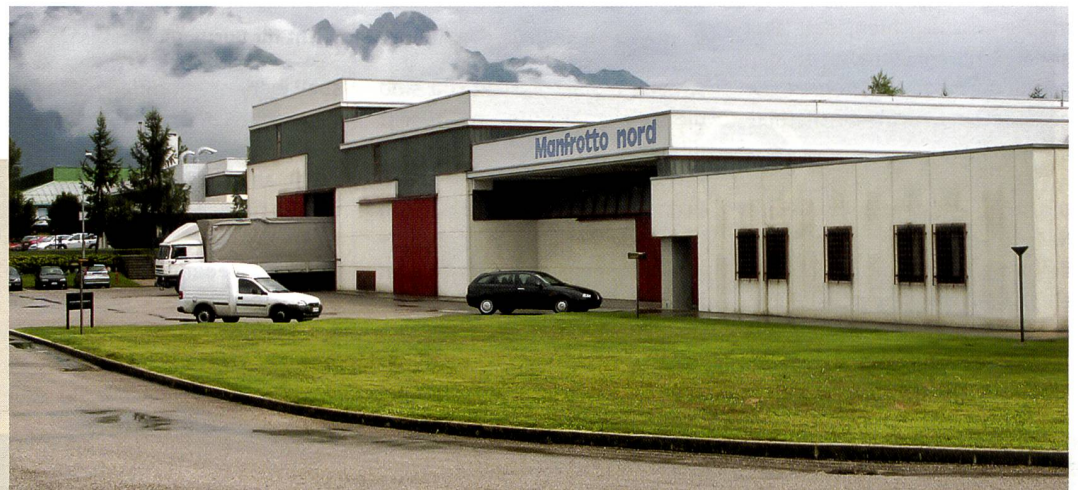
«Manfrotto Nord» ist die grösste von insgesamt 13 Produktionsanlagen von Manfrotto.