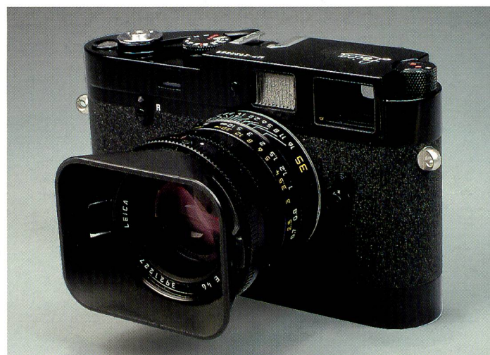
Das 35mm-Weitwinkelobjektiv ist ein Klassiker und war schon bei Cartier-Bresson und anderen Magnum-Fotografen beliebt.

Und ist der Kontrastumfang zu gross, muss man sich entscheiden, wo noch volle Zeichnung gewünscht ist. Allenfalls helfen auch andere Tricks weiter; den Bildausschnitt verändern beispielsweise oder, wenn in Schwarzweiss fotografiert wird, könnte der Film vorbelichtet werden, um den Kontrastumfang etwas zu reduzieren.