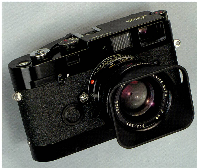
Klassischer Look, puristische Ausstattung: Die Leica MP verzichtet auf jeglichen Firlefanz und fotografiert zur Not auch ohne Batterien.

Ohne Zweifel ist die Leica M ein zeitloser Klassiker. Vor Jahresfrist kam mit der M7 erstmals eine Kamera der M-Serie mit Zeitautomatik auf den Markt. Kurz darauf folgte die Leica MP, die wir an dieser Stelle näher vorstellen wollen.