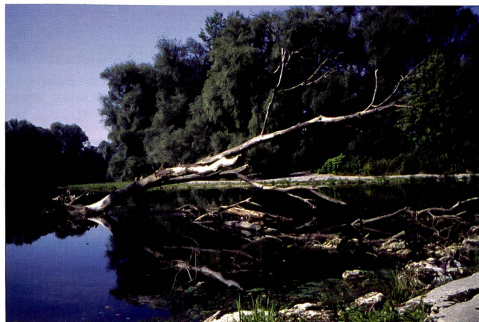
Die Trefferquote ist dank mittenbetonter Integralmessung sehr hoch. Doch will die Belichtungsmessung nach wie vor interpretiert werden.

Durch den Verzicht auf eine aus-klappbare Rückwand gewinnt die Leica ein gerütteltes Mass an Stabilität. Das Fotografieren mit der Leica MP hat etwas Archai-sches an sich, doch es ist über-haupt nicht kompliziert. Ein Druck auf den Auslöser aktiviert