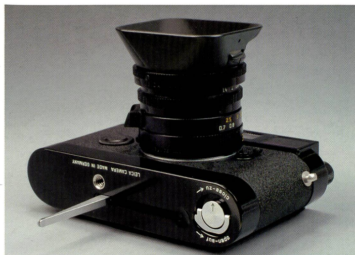
Der Schnellaufzug Leicavit M macht die MP schneller: Bis zu zwei Aufnahmen pro Sekunde sind mit etwas Übung schon möglich.

Der Filmtransport geht sehr schnell mit dem Daumen am Schnellschalthebel. Als optionales Zubehör ist der Schnellaufzug Leicavit M erhältlich. Dieser Transporthebel ist im Boden versenkt. Ausgeklappt, treibt er über ein Getriebe die Steuer- und Transportwelle der Leica M-Kameras an. Mit etwas Übung erreicht man damit locker ein bis zwei Aufnahmen pro Sekunde. Für die Leica M-Serie stehen Objektive mit Brennweiten von 21 bis 135 mm zur Verfügung. Diese Beschränkung auf das Wesentliche, macht die Leica so beliebt bei Reisefotografen. Die Ausrüstung bleibt sehr kompakt. Ausserdem hat die Kamera mit dem angesetzten 35mm-Objektiv zur Not auch noch unter der Jacke Platz. Damit fällt man weniger