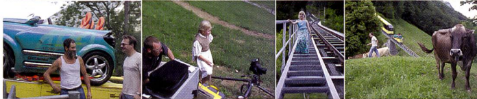
Ein halbes Dutzend Kühe mit einer im Fahrplan kursierenden Bergbahn zu koordinieren stellt eine besondere Herausforderung dar, fotografiert wurde mit einer Mittelformatkamera, 35 mm, Sinarback 54, 1/125 s.

deten aber auch das Fliegen im sehr engen Zeitfenster, in dem die Aufnahme gemacht werden musste. Diese spektakuläre Aufnahme wurde von einem Fernsichteam des deutschen Privatsenders Pro7 dokumentiert. Der Beitrag wird im Sendegefäss «Galileo» am 7. November ausgestrahlt.