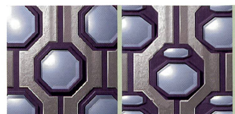
Die Pixelanordnung des Super-CCD der dritten Generation (links) und der neue Super-CCD-SR der vierten Generation (rechts).

Die beiden Aufnahmewerte werden nicht einfach linear miteinander verrechnet. Je nach Aufnahmesituation wird von der Kamerasoftware die Gammakurve angepasst. Der Gammawert stellt das Kontrastverhältnis dar: die Schwärzung dunkler Partien im Verhältnis zur Belichtungszeit. Der Gammawert sollte nicht immer gleich sein, sondern die Schattierungen je nach Situation bestmöglich wiedergeben. Bei der Entwicklung des Super CCD nutzten die Techniker von Fujifilm die Erfahrung von mehr als 60 Jahren analoger Fotografie. Wie beim «weicher» oder «härter» arbeitenden Fotopapier werden heute mit dem Super CCD unterschiedliche Kontraste optimal gewählt. Das Ziel, ein in jeder Aufnahmesituation ausgewogenes Bild zu erhalten, in dem sowohl die Schatten- und die Lichtzeichnung, jede Farbnuance differenziert dargestellt wird und die Brillanz bestechend ist, konnte mit der vierten Generation des Super CCD erreicht werden.