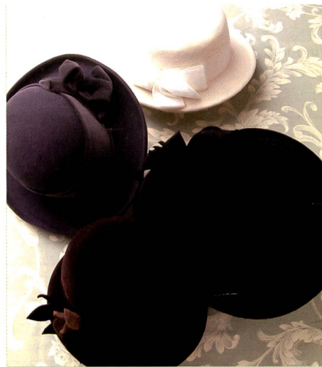
Dynamikumfang des Super CCD 3 (2002)

bereits die vierte Generation der Super CCD Sensoren vor. Mit der jüngsten Version, dem Super CCD SR dieses Imaging Sensors ist es Fujifilm gelungen, ein Aufnahmemedium zu konstruieren, das dem Film sehr nahe kommt. Denn ganz ähnlich wie beim Film verschieden grosse Silberhalogenid-Kristalle zusammenwirken, nämlich