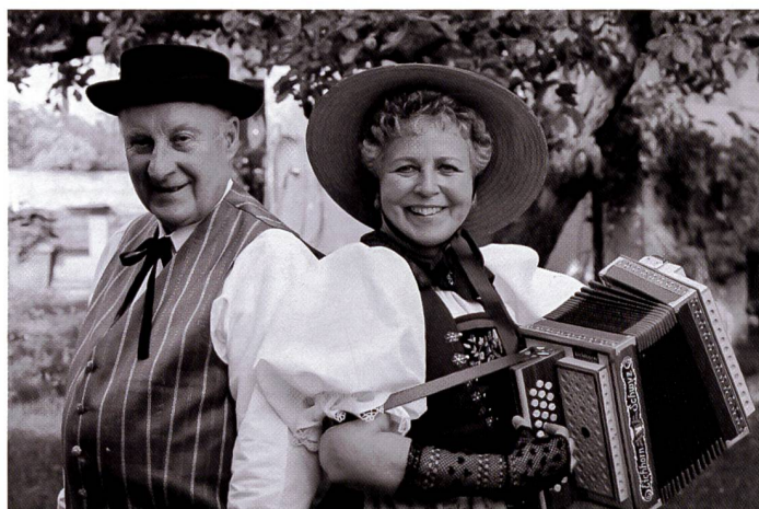
Bewusst gestaltete Werke, wie dieses Doppelporträt, sind urheberrechtlich geschützt. Auch die auf dem Bild gezeigten Personen haben ein Recht an ihrem eigenen Bild. Das Zürcher Obergericht sprach einer Konzertfotografie das gestalterische Element ab, mit fragwürdiger Begründung.

Gut möglich, dass viele Fotografen in ihrem Alltag keinen Gedanken an das Urheberrecht verschwenden. Doch gerade diese Berufsgruppe könnte besonders betroffen sein, wenn das Bundesgesetz revidiert wird. Was wohl bis spätestens 2007 der Fall sein wird.