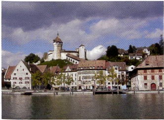
Dieses Postkartenmotiv ist urheberrechtlich nicht geschützt, weil es keine individuellen Gestaltungsmerkmale aufweist.

Die Interessenvertreter der Kulturschaffenden möchten die bei der Revision von 1992 erkämpften Zugeständnisse nicht wieder