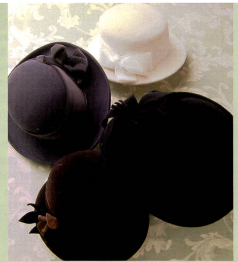
Dynamikumfang des modernen Super CCD SR