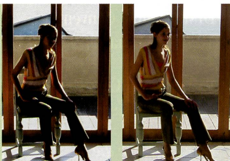
Während beim CCD 3 (links) das Meer im Hintergrund nicht mehr zeichnet, liefert der Super CCD HR auch in den Hosen feinste Details.

Fujifilm hat mit der «Super CCD» genannten Eigenentwicklung schon früh einen komplett eigenen und einzigartigen Lösungsansatz gefunden und diesen laufend verbessert. Jetzt liegt