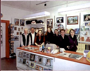
Foto Video Digital Schenk neu