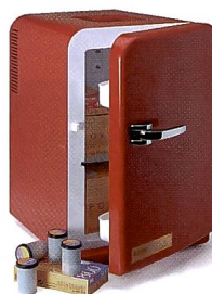
KODAK PROFESSIONAL Mini-Kühlschrank