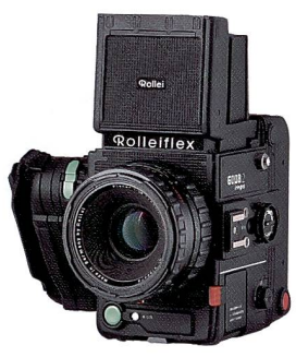
Die modernen Kameras von Rolleiflex bieten ein Höchstmass an Technik und Komfort, die 6008 AF sogar Autofokus.

zweiäugige Spiegelreflexkamera mit Wechselobjektiven. Pentax hat sich bei vielen Reisefotografen bewährt. Der Vorteil der Pentax 67 - neben dem grossen Format von 6x7cm - ist die Bedienung, die dank der kompakten Bauweise mit der einer Kleinbildkamera vergleichbar ist. Rolleiflex folgte dem Beispiel Victor Hasselblads 1966 mit der SL66, ei-