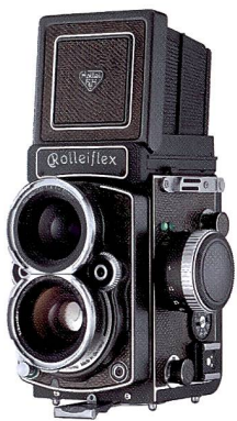
Zweiäugige Spiegelreflexkameras sind heute selten geworden. Umso mehr schätzen Nostalgiker die Rolleiflex-Modelle.

lichkeiten zu bieten, sondern auch integrierte Schnittstellen für den unkomplizierten Anschluss von digitalen Rückteilen. Leider nicht mehr hergestellt werden die Mamiya 6, eine Messsucherkamera für das Format 6x6 cm oder die C330, eine