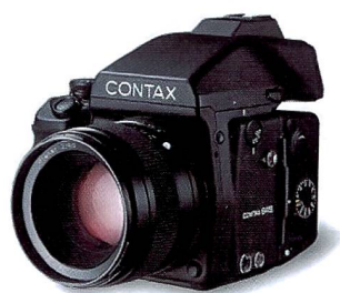
Contax: Mit der ersten Mittelformatkamera mit Autofokus überraschte Contax die Fachwelt an der Photokina 1998.

dere den neueren 645er-Modellen haben sie eine nie da gewesene Flexibilität. Dank digitaler Rückteile, wie sie von Imacon, Phase One, Sinar und vielen an-