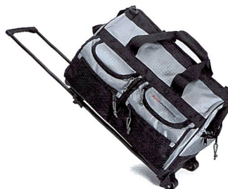
KODAK PROFESSIONAL Trolley-Reisetasche