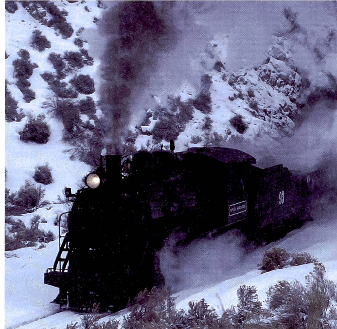
Klassisch: Für viele Fotografen stellt das quadratische Aufnahmeformat vieler Mittelformatkameras die ideale Grundlage dar. Der endgültige Ausschnitt kann später erfolgen und der Fotograf muss nicht lange überlegen, ob er die Kamera nun im Hoch- oder Querformat halten soll.

grafen zu einer gemächlicheren, bedachten Arbeitsweise. Mit drei bis vier Objektiven ist eine Mittelformatausrüstung meist komplett, während im Kleinbild oft