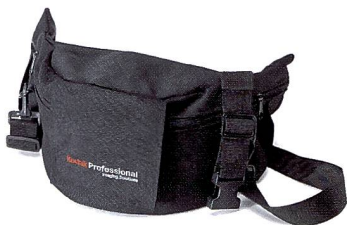
KODAK PROFESSIONAL Kameratasche