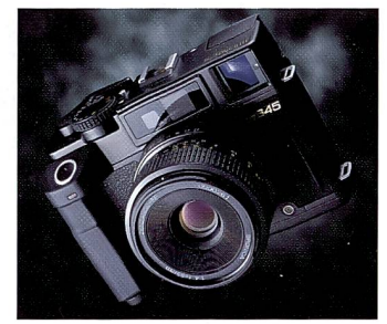
Zenza Bronica bietet Kameras für jedes Format, von 6x4,5cm (Bild) bis zum grossen 6x7cm.

Das Modell 6008 Integral wartet sogar mit Autofokus auf - wiederum eine Premiere im Format 6x6. Zenza Bronica ist eine weniger bekannte Marke, die einige Spezialitäten im Programm hat. So ist die RF 645 eine interessante Messsucherkamera für den Reisefotografen, die übrigens in Normalstellung hochformatige Bilder macht. Daneben hat Bronica mehrere Spiegelreflex-Modelle für die Formate 6x45 bis 6x7cm.