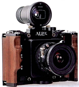
Alpa: Die Schweizer Edelkamera stellt hohe Anforderungen an den Fotografen, bietet jedoch völlig unverfälschte Fotografie.

Oft wird argumentiert, Mittelformatkameras seien teurer als (moderne) Kleinbildkameras. Dieses Argument greift zu kurz, denn wer in eine Mittelformatausrüstung investiert, wird diese über Jahre – wenn nicht gar für sein ganzes Leben – benutzen. Vergleicht man den Preis einer professionellen Kleinbild-Spiegelreflexkamera mit jenem eines Mittelformatmodells, relativiert sich der Preisunterschied schnell.