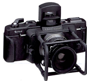
Fujifilm GX617: Diese Panoramakamera ist eine Ausnahmereiherung im Mittelformat und bei Reisefotografen äusserst beliebt.