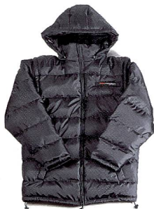
KODAK PROFESSIONAL Skijacke