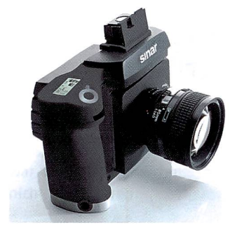
Sinar entwickelte eine modular aufgebaute Mittelformatkamera, die speziell für die digitale Fotografie konzipiert wurde.

ner modular aufgebauten Mittelformatkamera für das klassische 6x6 cm Quadrat. Meilensteine setzte Rolleiflex aber in den 70er Jahren, als die Rolleiflex-Serie 6000, ähnlich wie bei Kleinbildsystemen üblich, eine hochentwickelte Elektronik in die Kamera einbaute. Damit waren umfangreiche Kontrollfunktionen, sowie die Belichtungsmessung erstmals in der Kamera selbst untergebracht.