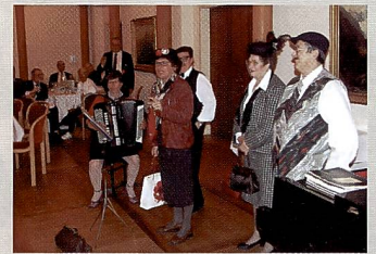
Urchig: «s'Chörli us de March»

Zum Fotomarkt Schweiz führte Schenk aus, dass dieser von einem starken Umsatzrückgang im Bildergeschäft und rückläufigen Margen geprägt sei. Wer rechtzeitig in den digitalen Printbereich und die Bildbearbeitung investiert hat, habe sicher den Umsatzrückgang etwas bremsen können, doch habe sich die schlechte Konsumentenstimmung – wie in vielen anderen Branchen auch – zusätzlich negativ auf das Geschäft ausgewirkt.