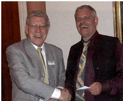
Präsidenten in Höchstform.

Der FGVO konnte auf ein sehr reichhaltiges Jahr zurückblicken. Schwerpunkte waren die Einführungskurse mit einem fortlaufenden Workflow, die Lehrabschlussprüfung mit sehr guten Ergebnissen, die Diplomfeier im Schloss Haldenstein mit der Ausstellung der Prüfungsarbeiten sowie diverse Gespräche zum