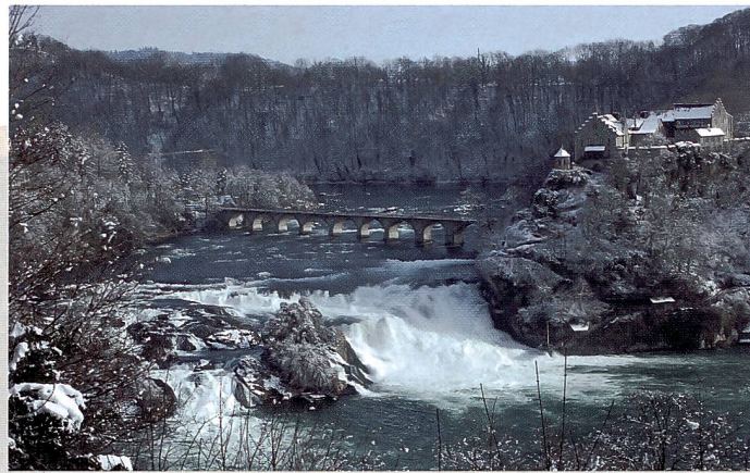
Das Schloss Laufen am Rheinfall zeigte sich als idealer Tagungsort.