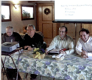
Die Fachhandelstagung am Montag fand auf dem Erlebnis-Bauernhof «Riethof» in Dachsen statt.