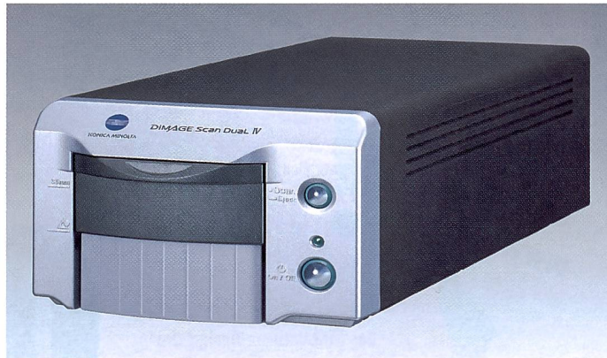
Der preisgünstige Dimage Scan Dual IV wurde technisch überarbeitet.

Der Dimage Scan Dual IV von Konica Minolta löst im unteren Preissegment den Scan Dual III ab. Das Folgemodell ist schneller und weist zudem ein höheres maximales Auflösungsvermögen auf. In der Bedienung gibt es kaum nennenswerte Unterschiede, neu ist hingegen der CCD-Sensor.