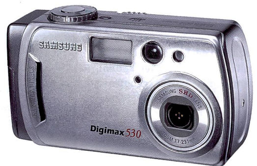
Digimax 530: preisgünstigste 5 Mpix-Kamera von Samsung.

ra entweder schützend gegen innen geklappt oder gegen aussen als Einstellbildschirm benutzt werden. In gedrehter Position kann entweder «ums Eck» fotografiert oder Selbstporträts gemacht werden. Er ist aber ebenso nützlich, um – nach unten gerichtet – über eine Menschenmenge hinweg zu