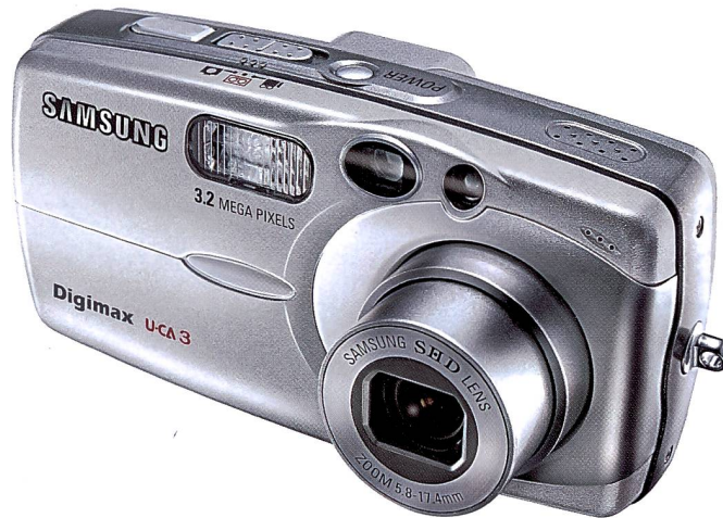
Die Digimax U-CA 3 ist mit ihrem unverwechselbaren Design erfolgreich.

Das bisherige Digimax Battery I-Pack, das weltweit erste CR-V3 Lithium-Ionen Akkupaket, ist mit 1300 mAh weiter verbessert wor-