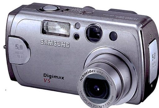
Die Digimax V5 verzichtet auf den Schwenkmonitor.

Im aktuellen Leadermodell von Samsung, der Digimax V50 mit fünf Megapixel, sind eine Reihe interessanter technologischer Features zu finden, die dem Anwender verschiedene praktische Vorteile bieten. Neu ist vor allem der schwenkbare und um 270 Grad drehbare Bildschirm, der Aufnahmen aus verschiedensten Perspektiven zulässt. Er kann hinten an der Kame-