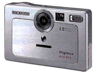
Ob die Samsung Digimax U-CA 401 in der Schweiz lieferbar sein wird, stand zum Redaktionsschluss noch nicht fest.