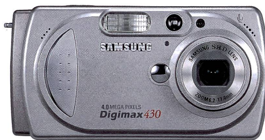
Die Digimax 430 ist in der Schweiz bereits auf dem Markt.

digital), das nicht von Schneider stammt. Auch besitzt die Digimax 530 die Möglichkeit manueller Einstellungen von A, S und M. Nahaufnahmen sind bis zu einer Entfernung von sechs Zentimetern sowie Videoaufnahmen mit Ton möglich. Die Aufzeichnungen erfolgen entweder im internen Spei-