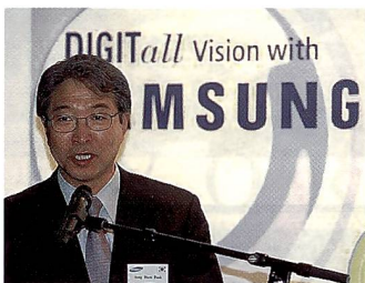
Jonghum Park, CEO Samsung.

Es können auch bewegte Szenen im Videomodus mit 30 Bildern pro Sekunde und VG-Auflösung als MPEG-4 mit Ton abgespeichert werden. Mit den als Zubehör erhältlichen Weitwinkel- und Televorsätzen können kreative Möglichkeiten der neuen Samsung V50 (und der V40) ebenso erweitert werden wie durch die Nahaufnahmemöglichkeit ab vier Zentimeter.