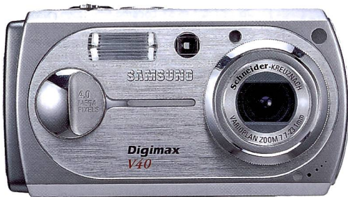
Die Digimax V 40 bietet viel Technik für wenig Geld.