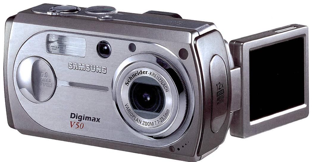
Samsung Digimax V50, das Topmodell mit 5 Megapixel sowie dreh- und schwenkbarem Monitor.

Entwicklung sechsmal mehr Leute als im Jahr 2001. Es ist ein motiviertes Team, dass sich allen Herausforderungen des Marktes stellen wird».