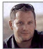
BOR DOBRIN, SPORTFOTOGRAF