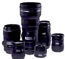
ZUIKO DIGITAL OBJEKTIVE

DER SUPersonic WAVE FILTER BEFINDET SICH DIREKT VOR DEM BILDSSENSOR. ER IST VON EINEM ULTRASCHALL-GENERATOR UMGEBEN, DER MITTELS SCHWINGUNGEN BINNEN MILLISEKUNDEN PARTIKEL VOM FILTER ENTFERNT.