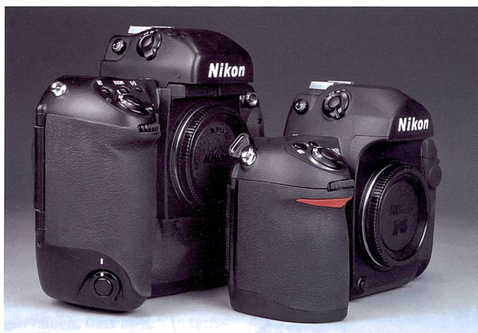
Die Bedienelemente an der F6 wurden verbessert, blieben aber mit wenigen Ausnahmen an gewohnter Stelle.

Dank dem integrierten Blitzbelichtungs-Messwertspeicher wird der einmal eingegebene, beziehungsweise der gespeicherte Wert auch bei Zoombe-