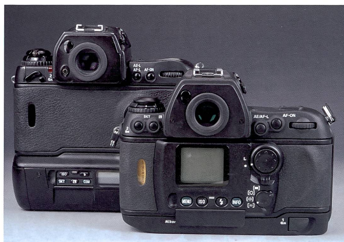
Die Rückwand der F6 erinnert an eine digitale Kamera. Doch das LC-Display dient der Navigation im Menü der zahlreichen Funktionen.

Konstruktion wurden die Lamellenbewegungen mittels einer Hochgeschwindigkeits-Videokamera und anhand von Computersimulationen analysiert. Eine Kontrolleinheit überwacht den Verschlussvorgang und korrigiert automatisch die Belichtung, sollte der Verschluss von der Kalibrierung abweichen. Die Verschlusslamellen bestehen aus einer Kombination von einem Material, das Nikon als DuPont Kevlar bezeichnet.