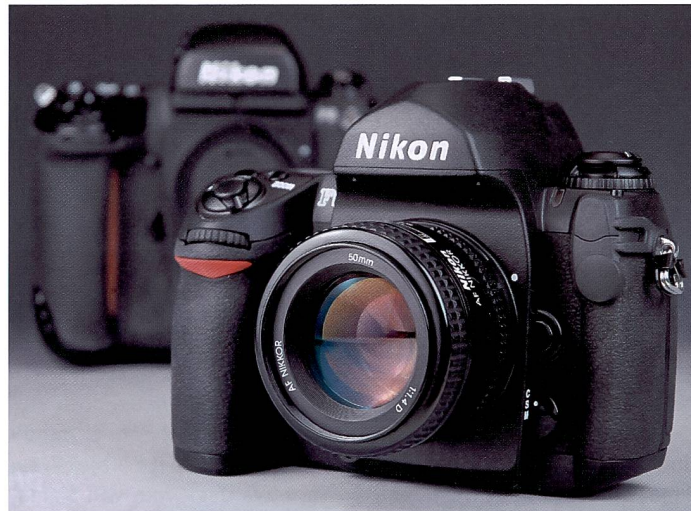
Die F6 verleugnet ihre Herkunft nicht. Sie liegt noch eine Spur besser in der Hand als ihre Vorgängerin und bietet viele technische Raffinessen.

Inmitten der Fülle an digitalen Neuheiten steht eine Kamera, die von Nikon mit dem Slogan «0,0 Pixel» beworben wird: Die F6. Wer glaubte, in der analogen Fotografie sei die Technik stehen geblieben, glaubt wohl auch, dass Kameras auf Bäumen wachsen. Ein Hands-On Bericht.