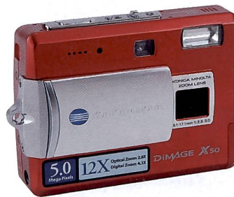
bild. Die Kamera besticht mit einer rekordverdächtigen Einschaltzeit von nur 0,5 Sekunden und einer Auslöseverzögerung von 0,06 Sekunden nach dem ebenfalls sehr schnellen Scharfstellen. Makroaufnahmen sind ab 6 cm möglich, die Bildkontrolle erfolgt über das 2"-Display. Nebst Belichtungsautomatiken für Porträt, Sport/Action, Landschaft, Sonnenuntergang, Nacht-

mehr so leicht vom Finger vignettiert wird. Das 2,8-fach Zoomobjektiv umfasst einen Bereich von 37 – 105 mm verglichen mit Klein-