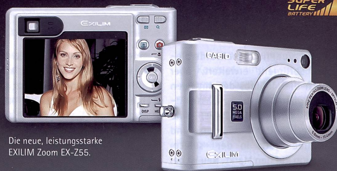
Die neue, leistungsstarke EXILIM Zoom EX-Z55.

Extrem stark, extrem schnell, extrem begehrenswert: die neue, leistungsstarke EXILIM Zoom EX-Z55. Ausgerüstet mit SUPER LIFE-Battery, extragroßem 2,5 Zoll TFT-Farbdisplay, 3fach optischem Zoom und vielen innovativen Funktionen und Features. Unentbehrlich für alle, die viele große Momente ganz nah festhalten möchten.