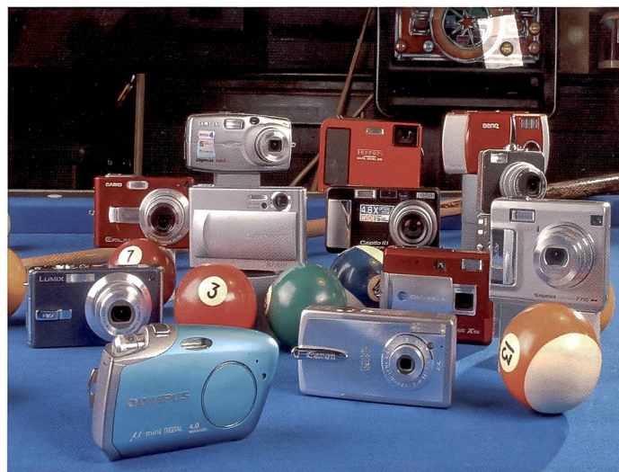
Grosse Zoomleistungen liegen im Trend – und erübrigen oft grosse Auflösung. Die Modelle der verschiedenen Hersteller sind recht unterschiedlich.

Digitalkameras müssen nicht zwingend wie die viereckigen Kistchen mit Film aussehen. Digital lässt Raum für Gestaltung, der nach und nach von verschiedenen Herstellern auch genutzt wird. Wir stellen einige der Kameras vor, die durch trendiges Design und hohe Bildqualität auffallen.