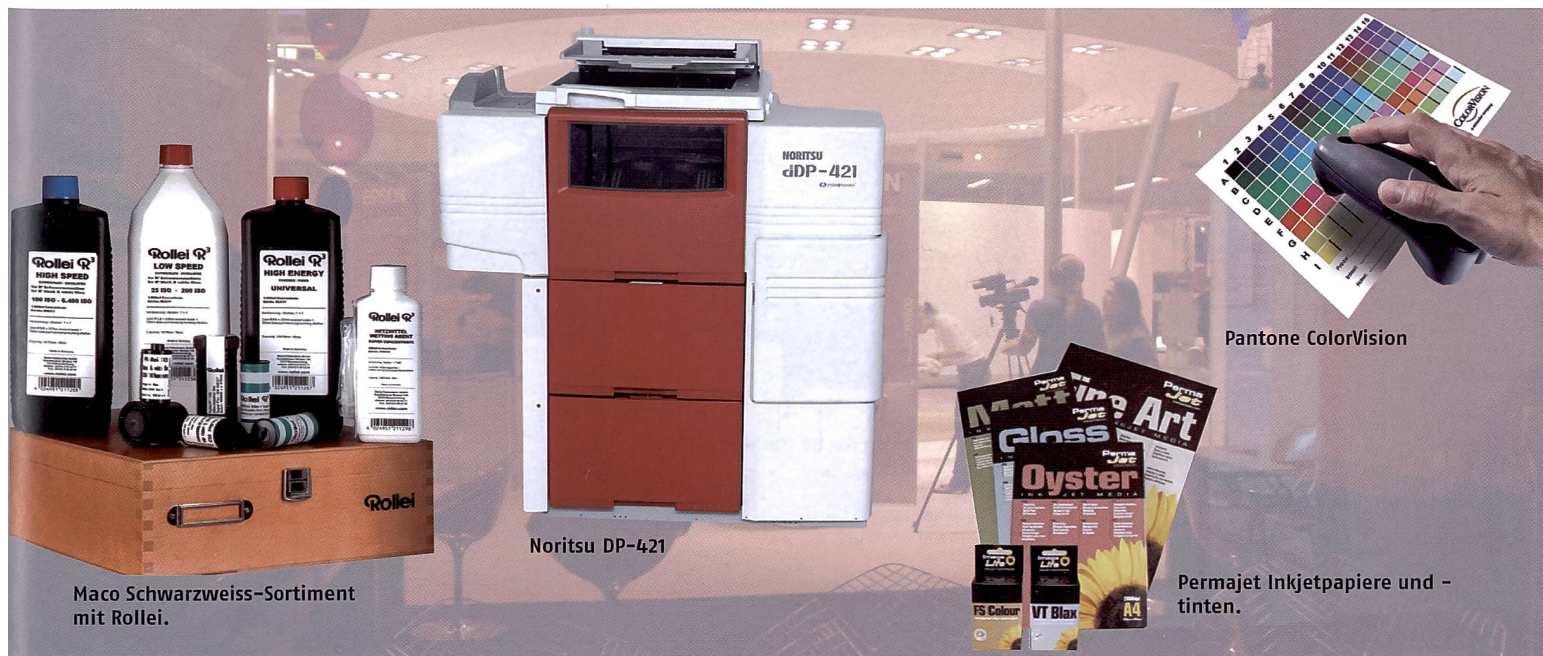
Maco Schwarzweiss-Sortiment mit Rollei.

nauere LCD-Charakterisierung. Rundum erneuert wurde die professionelle Komplettlösung für die Monitor- und Druckerkalibrierung und Profilerstellung SpectroPro Suite. SpectroPRO2 Suite für die professionelle Monitorkalibrierung und Druckerprofilierung besteht aus dem Spyder2-Kolorimeter, der Spyder2 PRO-Monitorkalibrierungssoftware, einem LED Spektrokolorimeter und der Druckerkalibrierungssoftware ProfilerPRO. Gebündelt wird die Suite mit den kostenlosen Vollversionen der Software-Produkte ColorVision Doctorpro zur Bearbeitung von