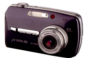
Die Olympus mju digital 800 ist zwar nicht primär für den Outdoor-Einsatz konzipiert, erfreulich, dass sie aber ein hohes Mass an Wetterfestigkeit mitbringt.

Mit einer Auflösung von acht Millionen Pixel steigt die mju 800 in eine neue Klasse Kompaktkameras auf (siehe auch Seite 20). Um diese Leistungsstärke bei der Bildaufnahme in vollem Umfang auszunutzen, hat Olympus das