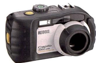
Ricoh Caplio 400G wide: Diese Kamera spricht die Sprache von Abenteuer und hartem Einsatz – ideal auch für den Einsatz entsprechender Berufsrichtungen.

Mit der mju hat Olympus als erster Hersteller die elegante Kombination von Designkamera und Wet-