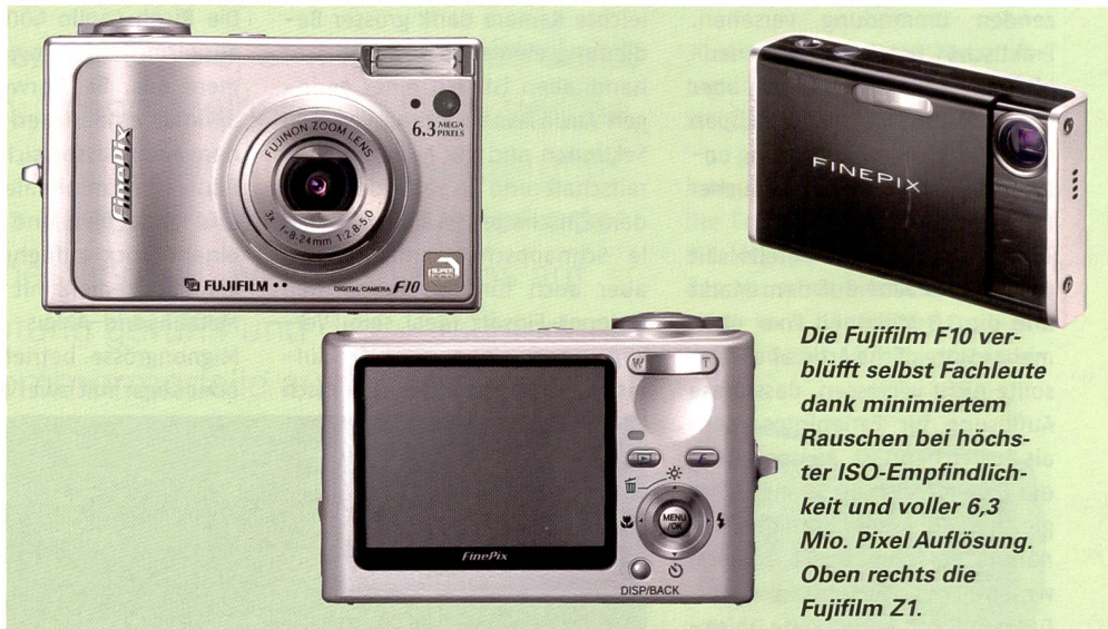
Die Fujifilm F10 verblüfft selbst Fachleute dank minimiertem Rauschen bei höchster ISO-Empfindlichkeit und voller 6,3 Mio. Pixel Auflösung. Oben rechts die Fujifilm Z1.

www.dpreview.com ). Dahinter steckt das neue Gesamtkonzept von Fujifilm, welches den Namen «Real-Photo-Technology» trägt.