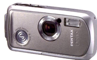
Der Pentax Optio WP sieht man ihre Wasserdichtigkeit weder an noch spürt man sie beim Preis.

Die Eckdaten der Optio WP sind 5.0 Megapixel, ein innenliegendes optisches Dreifach-Zoom (38 – 114 mm KB-Format) und ein grosser 2 Zoll-LCD-Monitor in ei-