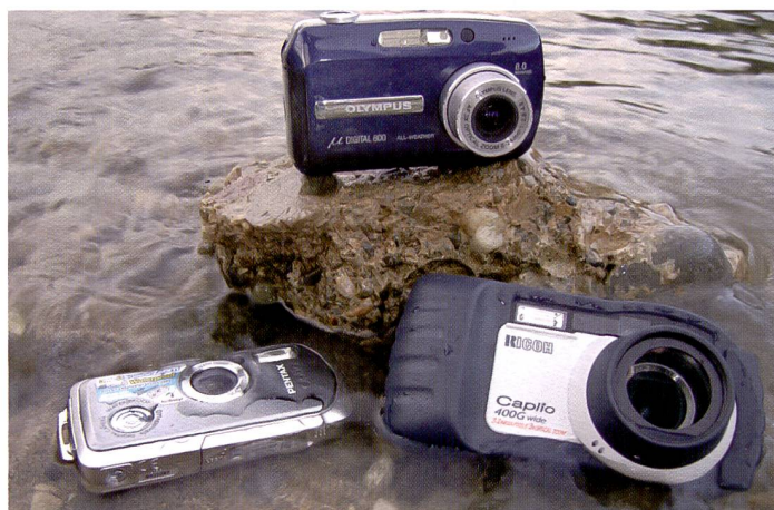
Während die Olympus mju 800 «nur» spritzwassergeschützt ist, bieten Pentax WR und Ricoh Caplio 400 G Wasserdichtigkeit bis 1,5 Meter Wassertiefe. Tiefer empfiehlt sich die Verwendung eines Spezialgehäuses.

Hurra, Ferien! Sonne, Strand, Wasser, Sand, Tauchen, Schnorcheln, Fun ... Doch welche Kamera nimmt man mit zum Badevergnügen? Wir haben den aktuellen wetter- oder wasserbeständigen Modellen etwas auf die Dichtung gefühlt und drei verschiedene neue Sommermodelle ausfindig gemacht.