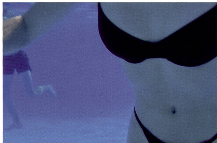
Unterwasserbild mit der Pentax Optio WP: gegenüber Unterwassergehäusen ist die Kamera bezüglich Bedienungsfreundlichkeit im Vorteil – dafür ist sie aber nur bis zu einer Tiefe von 1,5 Meter ausgelegt.

(bis zu 30 Minuten). Die Strapazierfähigkeit wird auch durch Schutzpolster an allen Seiten und im Objektivbereich gewährleistet. Dabei ist es von Vorteil, dass die leichte Kamera dank grosser Bedienungselemente einfach zu handhaben ist. Mit einer geringen Auslöseverzögerung von 0,14 Sekunden und der Aufnahmebereitschaft rund 1,8 Sekunden nach dem Einschalten ist sie eine ideale Schnappschusskamera, kann aber auch für den beruflichen Outdoor-Einsatz ideal sein. Verzögerungen gibt es nur beim Aufladen des Blitzgerätes. Praktisch