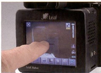
Leaf Aplus 75 mit grossem Touchscreen: übersichtlich und schnell.

Nachdem wir in unserer letzten Ausgabe bereits die neuen Rückteile von Leaf und Phase One vorgestellt haben, wollen wir nun das Leaf Aplus 75 mit 33 Millionen Pixel und das P45 von Phase One mit 39 Millionen Pixel in der Praxis testen. Für die Aufnahmen verwendeten wir eine Hasselblad H1 und eine Mamiya 645 AFD II. Die Rückteile sind aber über Ad-