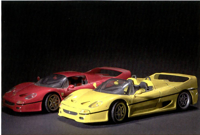
Der One-Shot-Spezialist Phase One hat es auch beim P45 fertiggebracht, das Maximum an Bildqualität aus dem Kodak-Sensor herauszukitzeln. Die Farben, der Dynamikumfang als auch die Detailschärfe überzeugen.

Capture One ist in der Lage, auch die Daten von anderen Herstellern zu entschlüsseln, sofern diese bereit sind, ihre Datenstruktur offen zulegen. Capture One ist