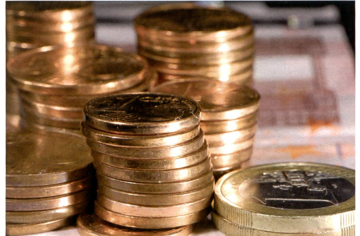
Bei dieser Aufnahme spielt der Dalsa-Sensor des Leaf Aptus 75 seine Stärken aus: Keinerlei Blooming, schöne Zeichnung und ein sehr knackiges Bild mit hoher Farbbrillanz.

me bereit sind. Mit rund 35 Aufnahmen pro Minute sind sie weniger für Action geeignet. Bei Sachaufnahmen und Architektur ist die Geschwindigkeit sowieso kein Thema.