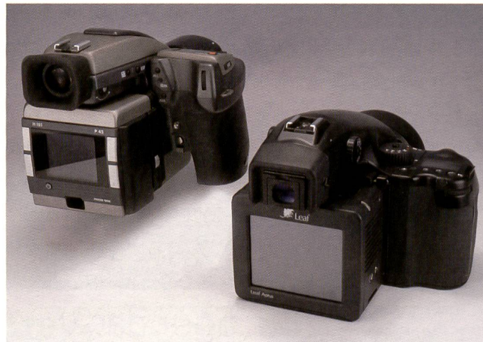
Das digitale Grossformat ist Realität: 33 und 39 Megapixel weisen Leaf Aplus 75 und Phase One P45 auf. Doch die beiden Rückteile unterscheiden sich nicht nur punkto Auflösung, sondern auch durch die Bedienung und die Architektur des Sensors. Beim Resultat überzeugen sie beide.

Die neuen Digitalrückteile mit 33 und 39 Megapixel werden vor allem Fachkamera-Fotografen begeistern: Auflösung à discrétion bei hohem Dynamikumfang und guter Weitwinkeltauglichkeit. Wir haben die beiden zurzeit erhältlichen Spitzenreiter der Digitalfotografie auf ihr Handling und Bildqualität geprüft.