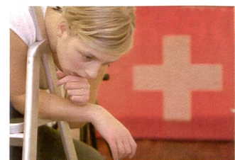
Bildkontrolle: Die digitale Fotografie gibt die Sicherheit für ein gutes Bild in engem Zeitrahmen.