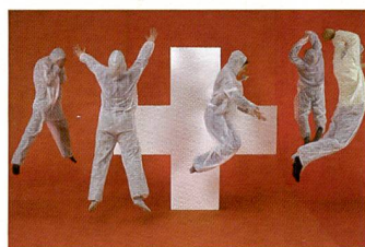
Kreativ: Die Studierenden, in Malerbekleidung, beim Testshooting vor Ort im Bundeshaus.