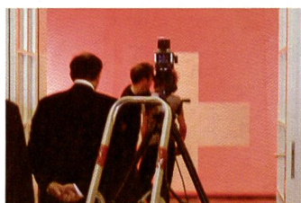
Platznot: Mit der Hasselblad mit 80er-Objektiv musste bis in den Flur zurückgewichen werden.