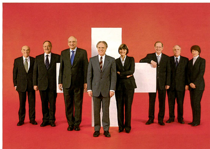
Die Schweizer Landesregierung, fotografiert von Studierenden der Fotografischen Abteilung der Schule für Gestaltung in Zürich. Bewusst hat das Kreuz keinen dreidimensionalen Charakter, die Gruppe integriert sich «in die Schweizerflagge». Rechts aussen Bundeskanzlerin Annemarie Huber-Hotz.

Der Bundespräsident bestimmt, wer das offizielle Bundesratsfoto, unmittelbar nach der Verteilung der Departemente im Dezember, aufnehmen darf. Für 2006 wollte Bundespräsident Leuenberger ein junges Team und schlug selbst die Schule für Gestaltung in Zürich vor, deren kreative Ausführung für Aufsehen sorgt.