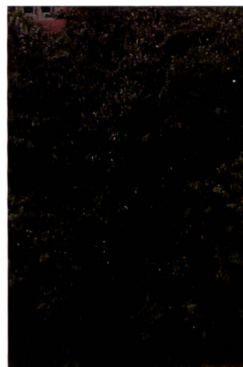
100%- Ansicht der Schattenpartie: Kein Rauschen auszumachen. 200%- Ansicht: minimale JPEG-Artefakte, durch RAW-Daten vermeidbar.