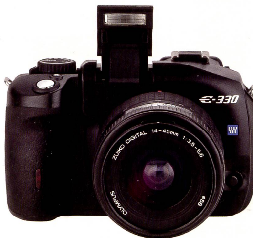
Die Olympus E330 dürfte nicht nur ihrer handlichen und leichten Bauweise wegen Freunde finden, sondern auch für Spezialanwendungen wie Unterwasserfotografie dank Livebild ideal sein. Sie wird im Kit mit einem Zuiko 14 bis 45 mm Objektiv ausgeliefert.

Kennen Sie den Effekt, wenn Sie nach langem Gebrauch einer Kompaktkamera eine Spiegelreflex in die Hand nehmen? Spontan sucht man das Livevideo hinten auf dem Display. Die Vorzüge dieser Technologie gepaart mit den Qualitäten einer Spiegelreflexkamera bietet die Olympus E330.