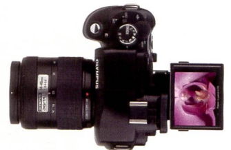
Das verwendete Porroprisma erlaubt eine besonders schlanke Bauweise des Kamerakörpers.

Zum Speichern der Daten können sowohl CompactFlash als auch xD-Picture Cards genutzt werden. Die Bilddaten lassen sich in den Formaten JPEG, TIFF und RAW speichern. Als Kamera für den Highend Amateur lässt die E330