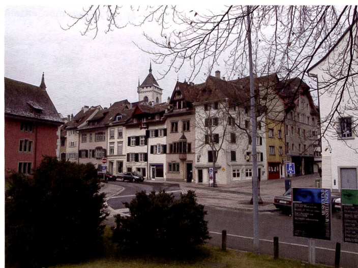
Trotz trüben Winterwetters, die Olympus E330 liefert knackige Farben und weist einen hohen Kontrastumfang auf.

Mit der E330 schlägt Olympus ein neues Kapitel in der Geschichte der digitalen Spiegelreflexkameras auf. Zwar gab es schon zaghafte Ansätze für eine Livevideo-Funktion bei Canon und Fujifilm und im Profisektor arbeiten Fir-