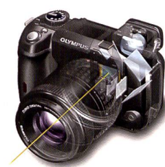
Im B-Modus wird das Livebild direkt mit dem Aufnahmesensor erzeugt und kann bis zu 10fach vergrössert werden – für absolut präzise Aufnahmen, beispielsweise im Makrobereich.

einen hohen Bedienkomfort. Für den weniger versierten Anwender erlaubt sie auch direkte Schwarz-Weiss-Aufnahmen mit Farbfiltereffekten. Wie alle Kameras des Olympus E-Systems ist auch die E330 mit dem Supersonic Wave Filter aus-