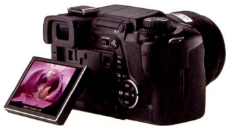
Das ausklappbare Display gemahnt an die Kompaktmodelle von Olympus.

Spontan würde man sagen: Ja, die Kamera kenn ich doch, das ist die Olympus E300 mit Porro-Prismensucher. Die Kamera, die eine sehr spezielle Fangemeinde fand, die die handliche, flache Bauweise im Four/Third Standard zu schätzen wusste. Doch bei genauerem Hinsehen entdeckt man gravierende Unterschiede schon beim Äusseren. Das heraus-