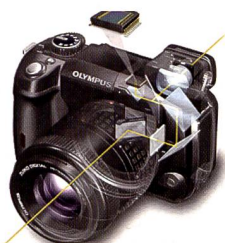
Im A-Modus übernimmt ein zusätzlicher kleiner CCD mit 92% Bildabdeckung hinter einem halbdurchlässigen Spiegel die Aufgabe des Livebildes – ausreichend für alle bewegten Bilder.

men wie Leaf und Sinar schon lange mit dem Livevideo, aber es ist das erste Mal, dass eine Ama-