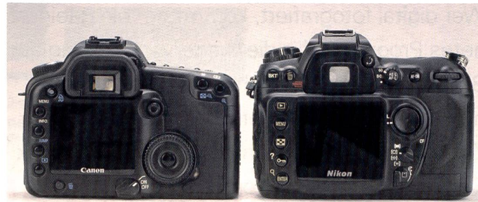
Aufgeräumt: Beide Kameras, die Canon EOS 30D (links) und die Nikon D200 folgen den bewährten Bedienungskonzepten ihrer jeweiligen Vorgänger- oder teureren Profimodellen. Die Displays sind grösser geworden und lassen sich auch aus einem Winkel von bis zu 170° noch angenehm betrachten, das der D200 ist sogar noch etwas grösser ausgefallen.

mutlich ab diesem Sommer verfügbaren Software Capture NX, die umfassende Bearbeitungsmöglichkeiten von RAW-, bzw. NEF-Daten und JPEG erlaubt,