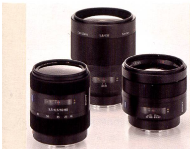
Neue Objektiv von Carl Zeiss: 1:3,5-4,5/16-80, 1:1,8/135 und 1:1,4/85 mm.

Neben der breiten Palette an Objektiv bietet Sony auch ein umfangreiches optionales Zubehörsortiment für die \alpha 100 an. Die beiden externen Blitze mit variablem Ausleuchtungswinkel von 24 bis 85 mm HVL-F56AM (LZ 56) und das HVL-F36AM (LZ 36 bei ISO 100) sind ideal für die kreative Blitzfotografie.