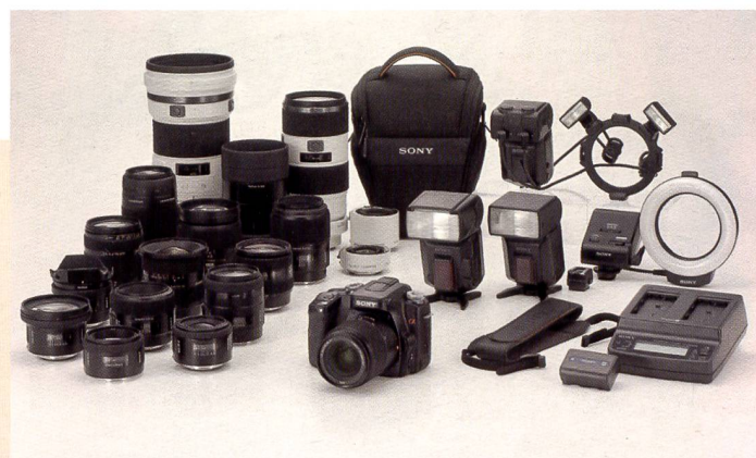
Sony präsentiert gleich zu Beginn ein breites Zubehörsortiment bestehend aus 19 Objektiv, zwei Konvertern, zwei Blitzgeräten und diversen Spezialitäten.