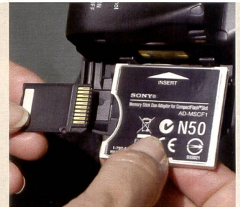
Die Alpha 100 nimmt über einen CF-Adapter auch Memory Sticks auf.